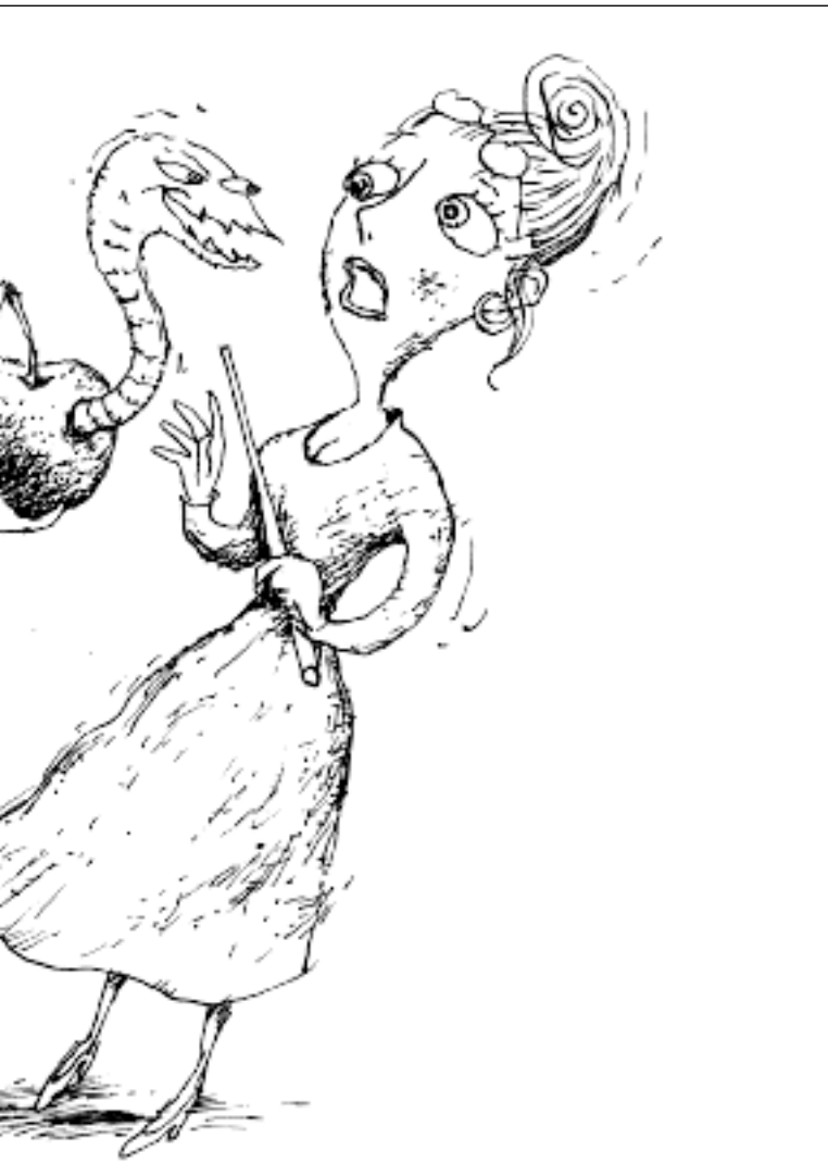
TEGNING: OTTO DICKMEISS

lade sig gøre, før man har erkendt, at der er et problem. En del af den erkendelse består i at være vidne til, at magten er smuttet fra én, at man allerede er på flugt. Om man kan standse sin flugt, vende sig om mod skurken og tydeligt formulere, hvad det er ved vedkommendes adfærd, der er uacceptabelt, afhænger af ens personlige evner og ressourcer.