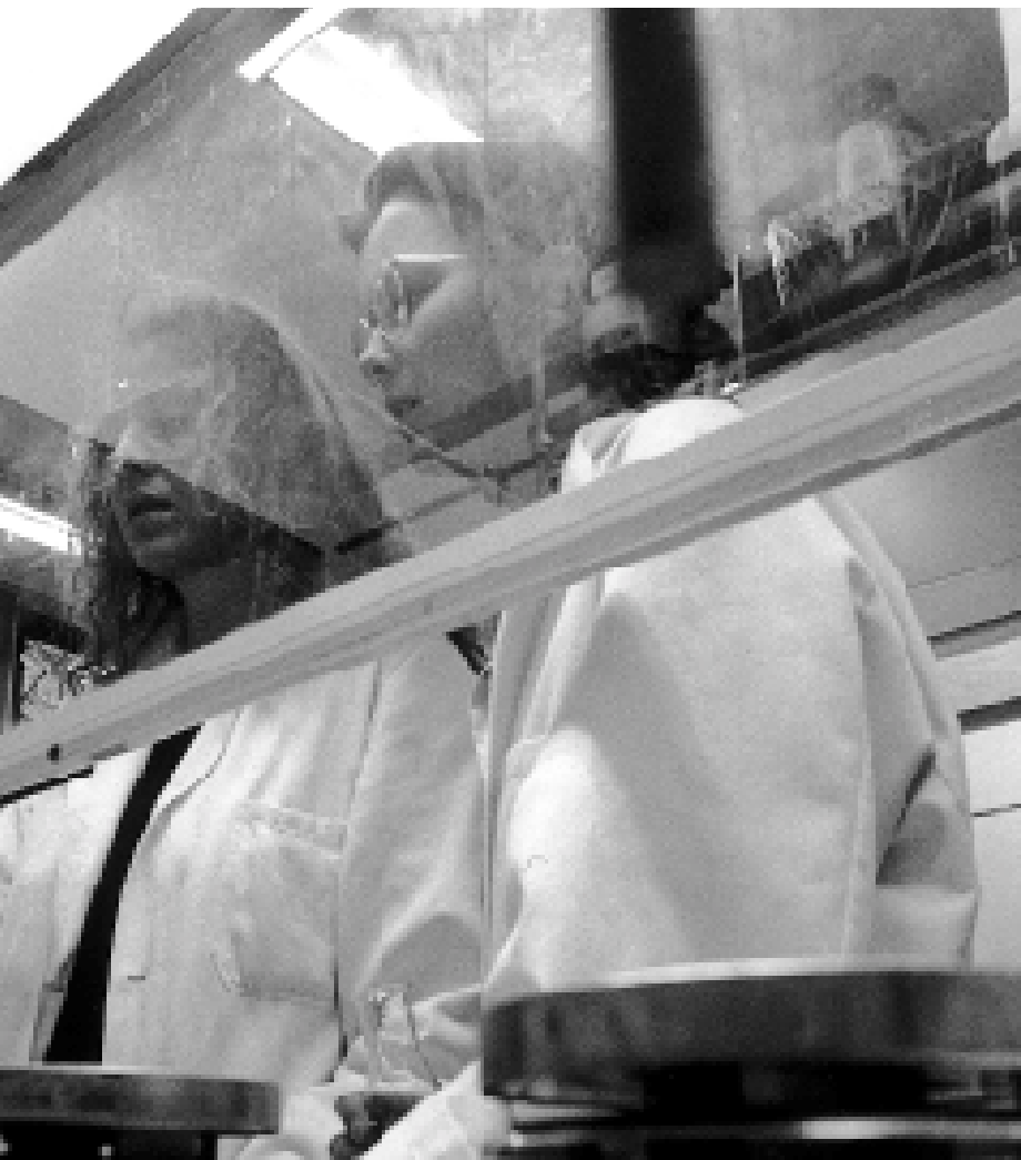
Eksplodingsagtig brand og stikflamme-eksplosion har været blandt ulykkestyperne

naturligvis svært at tage de nødvendige sikkerhedsregler.