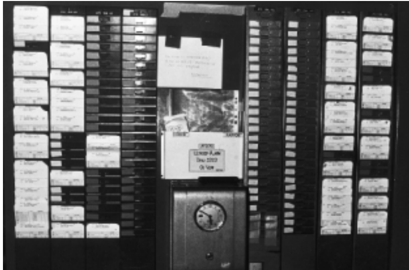
Skal universitetslærere til at stemple ind og ud?

Således var alt i den skønneste orden, troede dekanen.