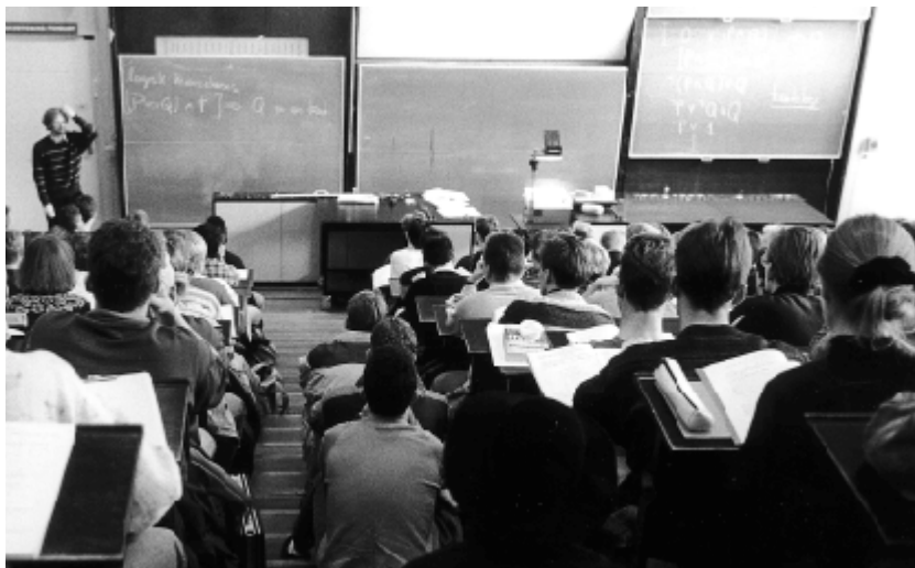
Der er i forvejen tæt pakket i DTU's auditorier. Det bliver måske værre

Ifølge de ansatte var det et udtryk for dårlig ledelse, at DTU i årene op til den