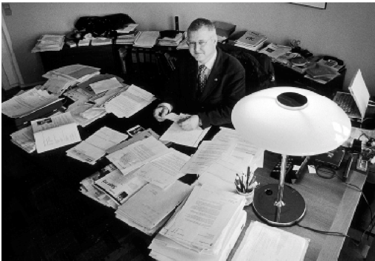
Overenskomstforhandlingerne har skabt travlhed på AC-formandens skrivebord