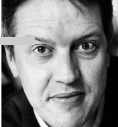
Af CARSTEN Y. HANSEN , DM's forskningsinstitutionsafdeling