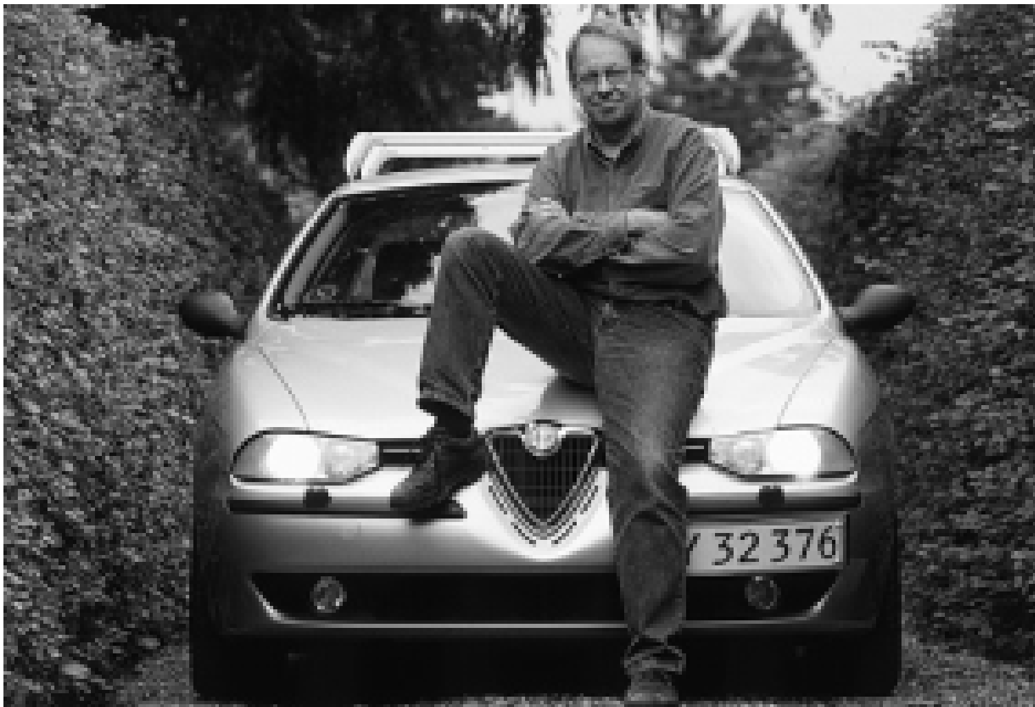
DTU's nye rektor poserer til ære for FORSKERforum på låget af 190 hk