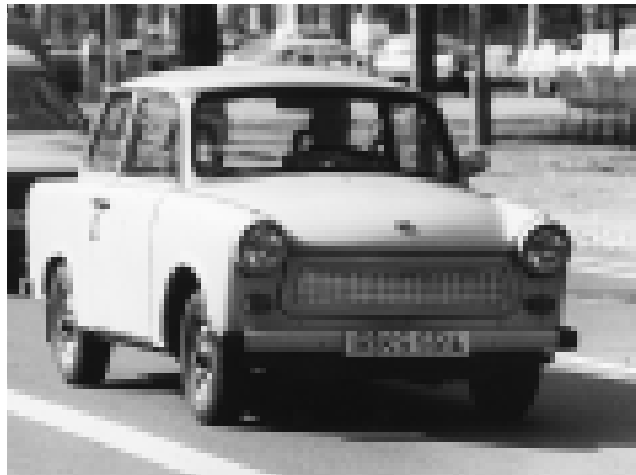
Er sektorforskningen en Trabant - eller var det et vildskud i en ATV-rapport?