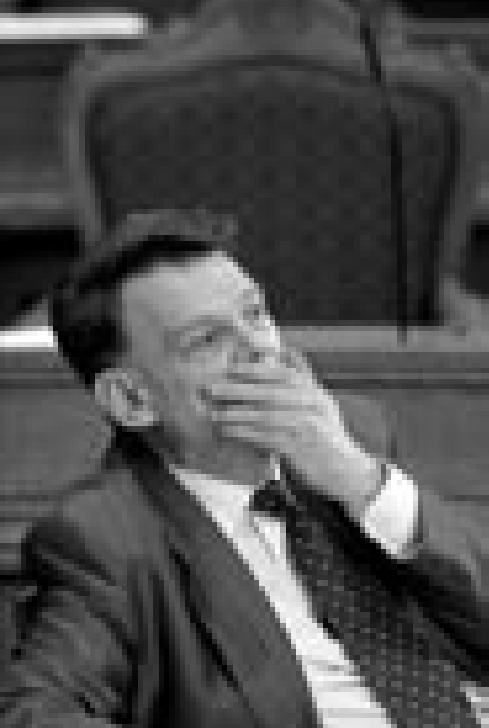
Jesper Langballe under folketingsdebatten