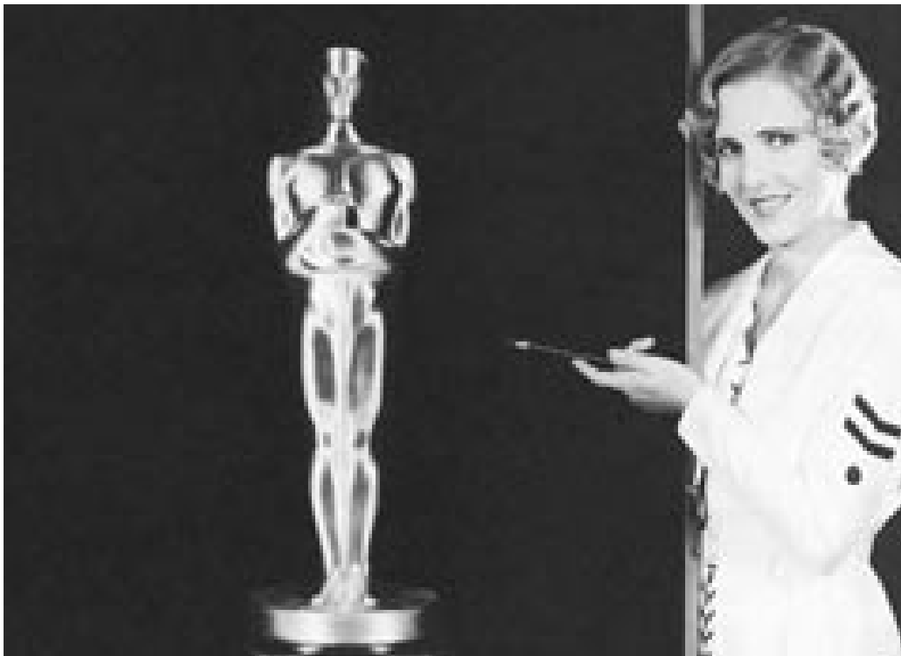
Det nytter ikke at præsentere sig som Oscar-kandidat, hvis realiteterne ikke lever op til et image, der er skabt ...

DTUs har fortsat et elendigt image på trods af den styrkede og mere synlige ledelse. Det viste nyhedsmagasinet INGENIØRENS profilundersøgelse 2003 blandt 100 danske ”virksomheder.