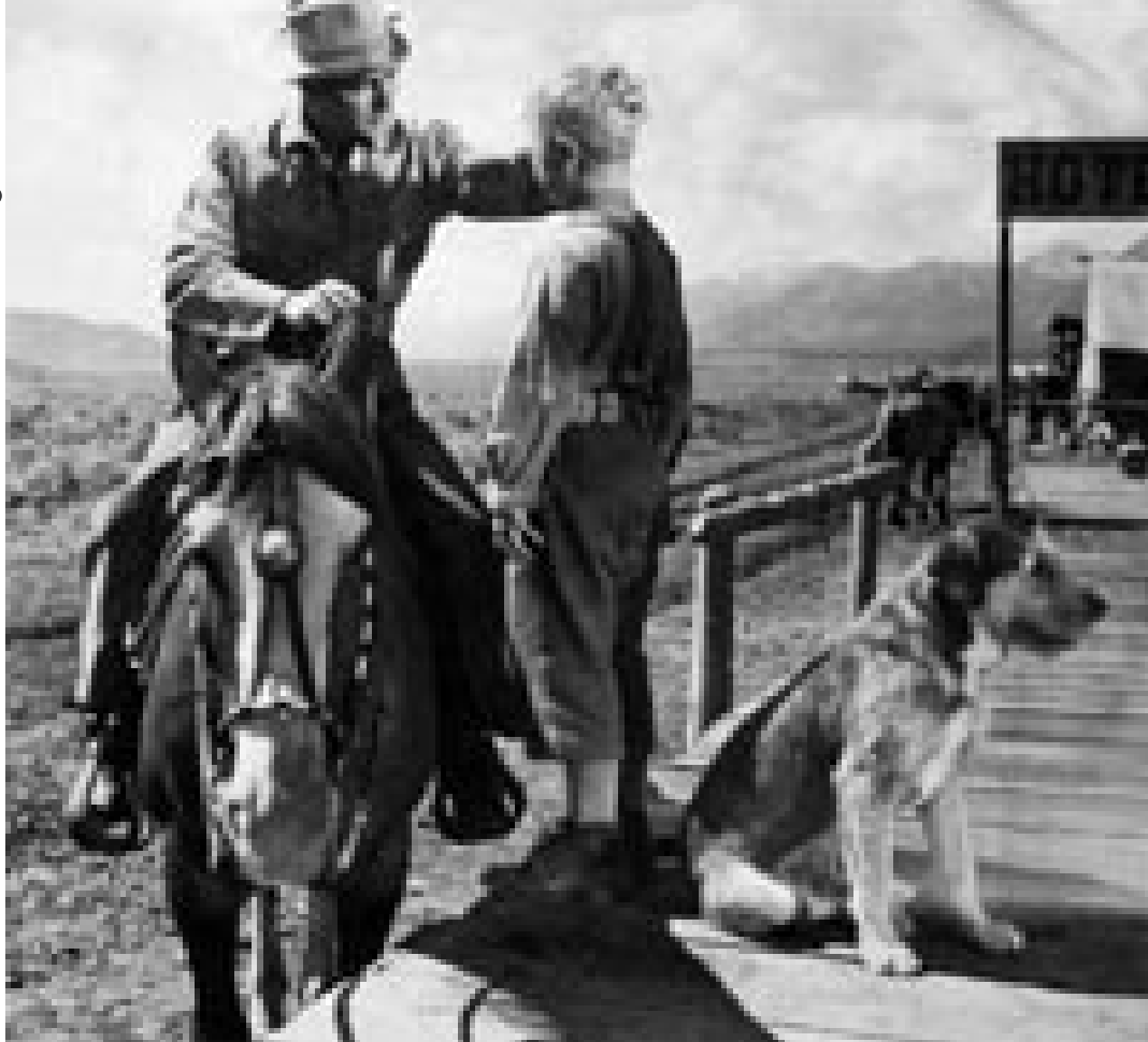
Boy, hold et vågent øje ...

”Det er vigtigt at folk ikke føler de bliver overvågede, fordi de kommer fra et andet land eller læser på et bestemt