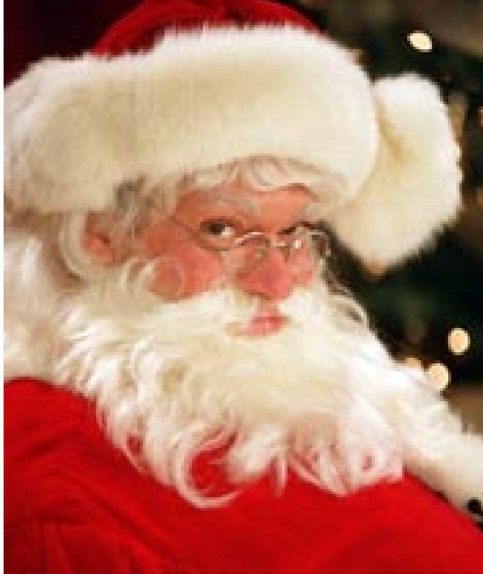
En lærer på et humanistisk småfag i Aalborg har været ansat i den billigste stillingskategori, som undervisningsassistent, i 20 år. FORSKERforum benytter sagen til at tyvstarte julen ved at bringe et foto af verdens mest kendte deltidsansatte

Så nu har han fået sin ansættelsesproblem helt ind på livet.