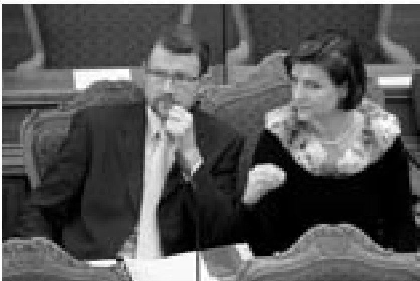
Der er kamp om kultur, revir og penge, når CVU'ere og universiteter støder sammen. Konflikten præger derfor også forholdet mellem de to ministre, Sander og Tørnæs.