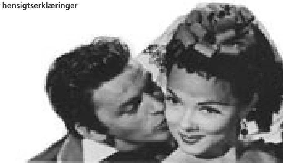
CVUer og universiteter behøver ikke at elske hinanden – men de er nødt til at finde ud af, hvad 'forskningstilknytning' indebærer for at få forholdet til at fungere ....

Det er imidlertid stor forskel på konkretiseringsgraden i de indgåede kontrakter. I de klareste samarbejdsaftaler – fx mellem Handels- og IngeniørHøjskolen i Herning og Handelshøjskolen i København - er der indgået detaljerede kontrakter om, hvorledes den faglige opgradering skal ske i praksis, hvorledes støtten skal for-