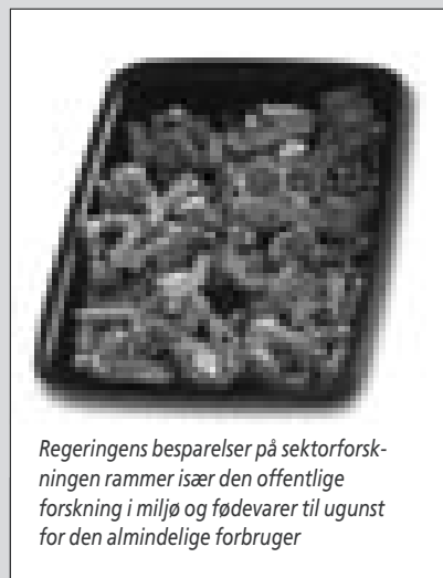
Regeringens besparelser på sektorforskningen rammer især den offentlige forskning i miljø og fødevarer til ugunst for den almindelige forbruger