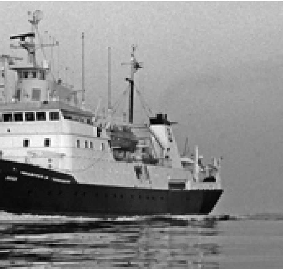
Dana skal bygges om for et ukendt antal millioner. Og så koster den hver dag mellem 70-100.000 kr. at holde sejlede, så alene driftsregningen får projektet til at løbe op i mellem 15 og 20 mio. kr.