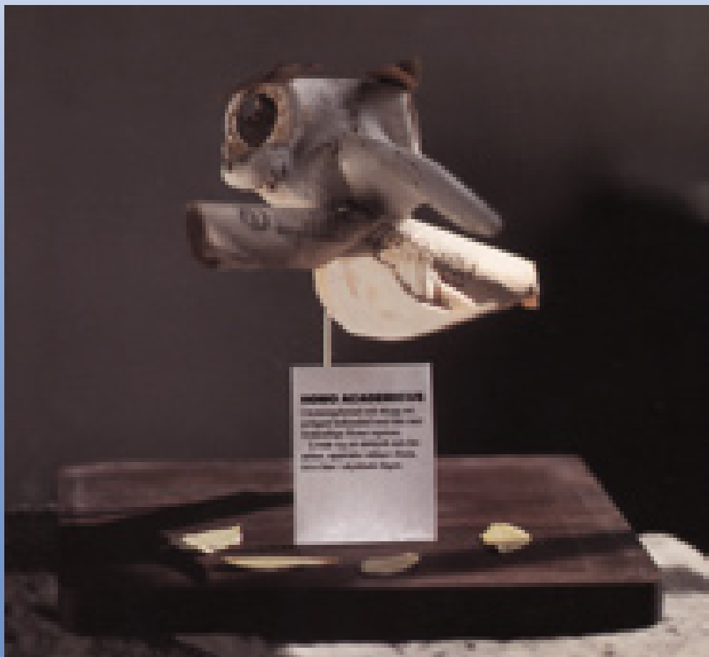
Omslaget er en installation med et kohoved-skelet: ”HOMO ACADEMICUS. Udrydningstruet og sky art, delvis i familie med den mere livskraftige HOMO SAPIENS. Ernærer sig især med særtryk og fodnoter, optræder sjældent i flok, trives bedst i skygge”

De unge kan imidlertid også modvirke usikkerheden: