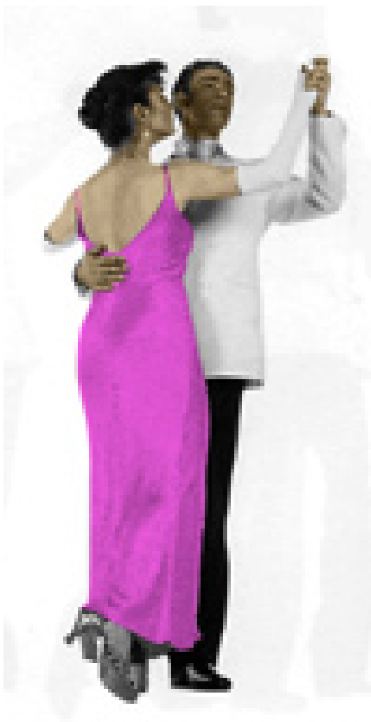
Det vigtigste i et ph.d.-forløb er, at stipendiaten og vejlederen finder ud af at danse med hinanden ...

”Specielt er det vanskeligt, hvis vejlederen og den studerende ikke kender hinanden særligt godt. Men selv