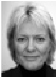
Statsrådet Kristin Clemet

Clemet mener ikke, at alternativet til reguleret handel med uddannelse er fravær af handel med uddannelse, men voksende ureguleret handel: "GATS kan bidrage med sådanne reguleringer,