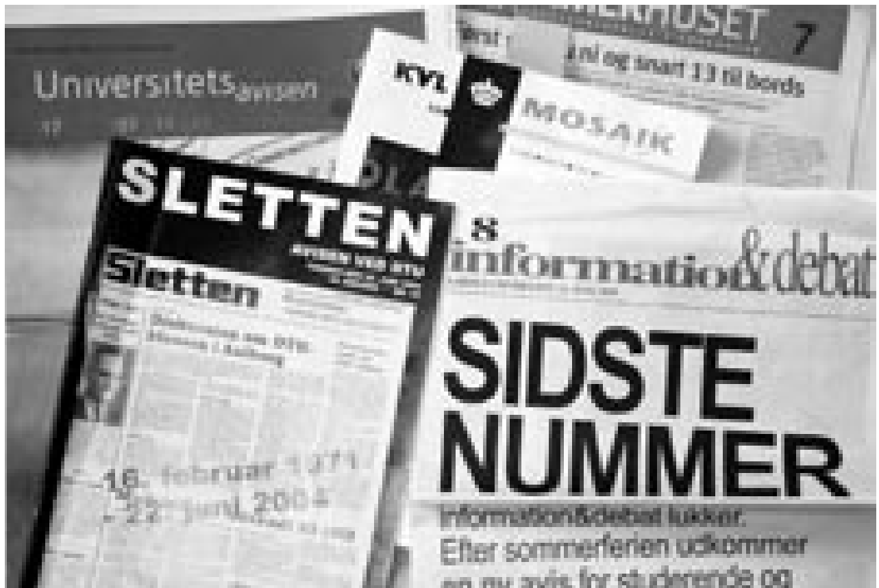
DTU's SLETTEN lukker efter 33 år, Århus' Information og Debat omlægges. Der er grøde i universitetsaviserne

Landbohøjskolens Mosaik, Århus' Information & Debat og DTU's Sletten er under forandring. Nye kommunikationsstrategier fra universiteterne sætter bladene og den fri debat under pres