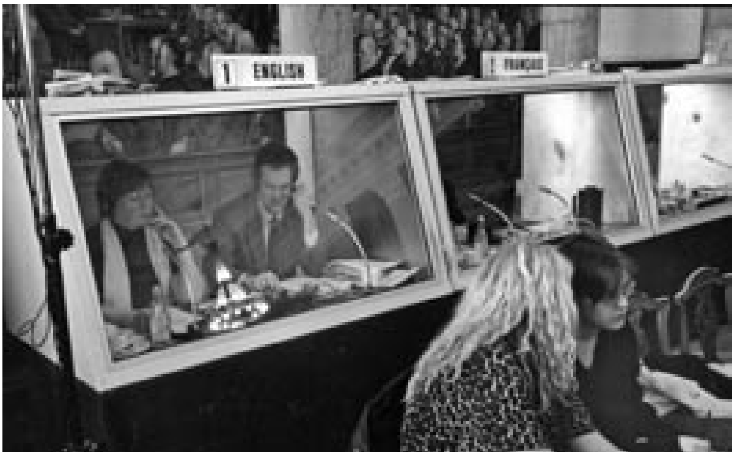
Danske forskeres tekster burde oversættes af professionelle, så pointer ikke går tabt i sproglig ubehjælpsomhed, foreslår en forsker. Det er økonomisk urealistisk og iøvrigt unødvendigt, svarer en anden

primære sprog på kandidatuddannelserne skal være engelsk i 2010.