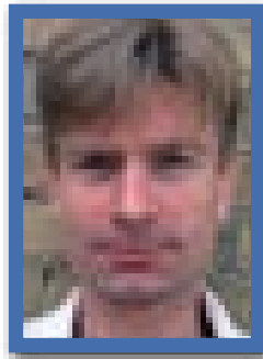
Af Anders Correll, JAF