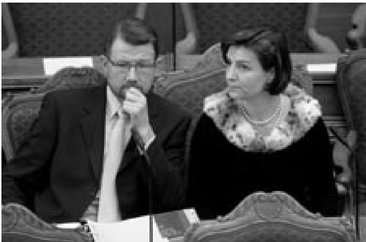
Videnskabsminister Sander og undervisningsminister Tørnæs er tilsyneladende helt enige om, at CVU'ere skal have universitetstitlen

de enkelte uddannelsesgrene, men også til de studerende, som i dag sidder med i studiebestyrelserne.