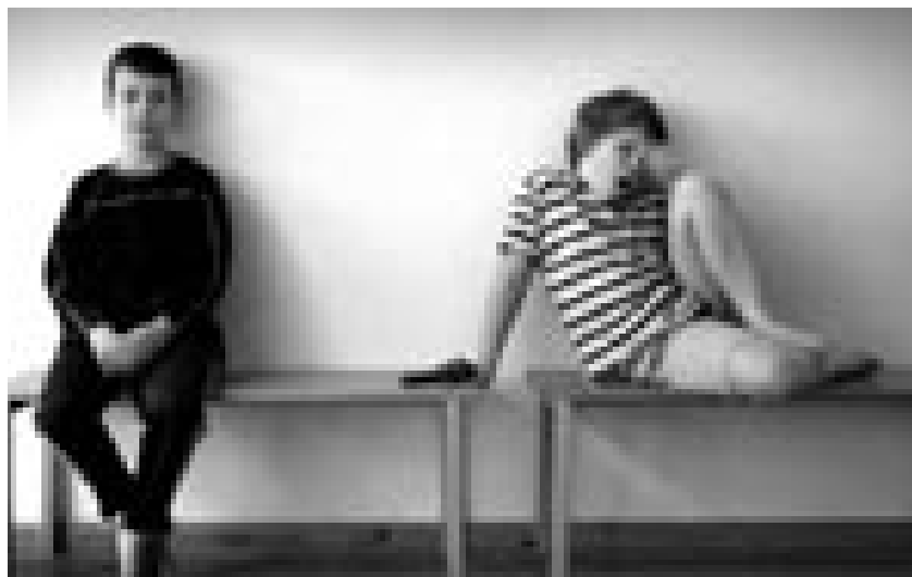
BLINDGYDE. Ny statistik viser, at mindre end hver anden adjunkt får "sit lektorat". De fleste ryger ud af systemet (Se forsideartiklen). Mange oplever således, at adjunkturet er en blindgyde

På nogle institutter og fakulteter (fx på naturvidenskab i Århus) har man en helt bevidst politik om ikke at ansætte unge i adjunkturer. I stedet ansættes de i rene forskningsstillinger med den argumentation at det giver dem bedre tid til at kvalificere sig, fordi det ikke stilles over for krav om at undervise.