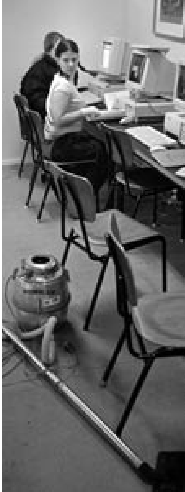
Tiden til vejledning indskrænkes, så læreren enten bruger mere tid end normeret – eller sætter de studerende til at klare sig selv

”Det triste er, at det er vejlederne, der kommer til at sidde med aben. Kan man bære at afbryde et specialeforløb? Det bliver op til vores egen samvittighed, hvor timerne skal komme fra. Jeg vil