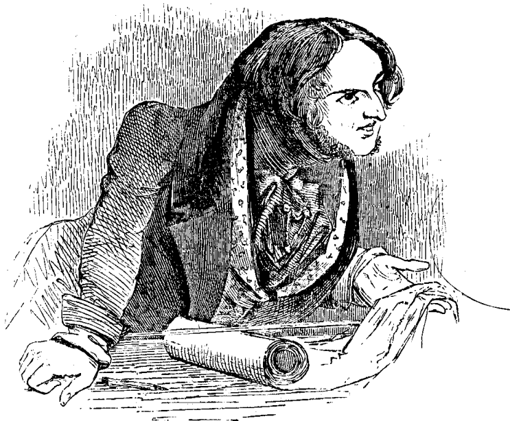
Moderne publiceringsformer er løbet fra bogtrykket – men forskersamfundet holder fast i de gamle former

Selvom alle forskere har stor glæde af internet, intranet og e-mail, så er det de færreste, der udelukkende vil publicere på nettet. For det kan rejse tvivl om troværdigheden. Men burde projekter af stor offentlig interesse - fx Magtudredningen - ikke være på nettet?