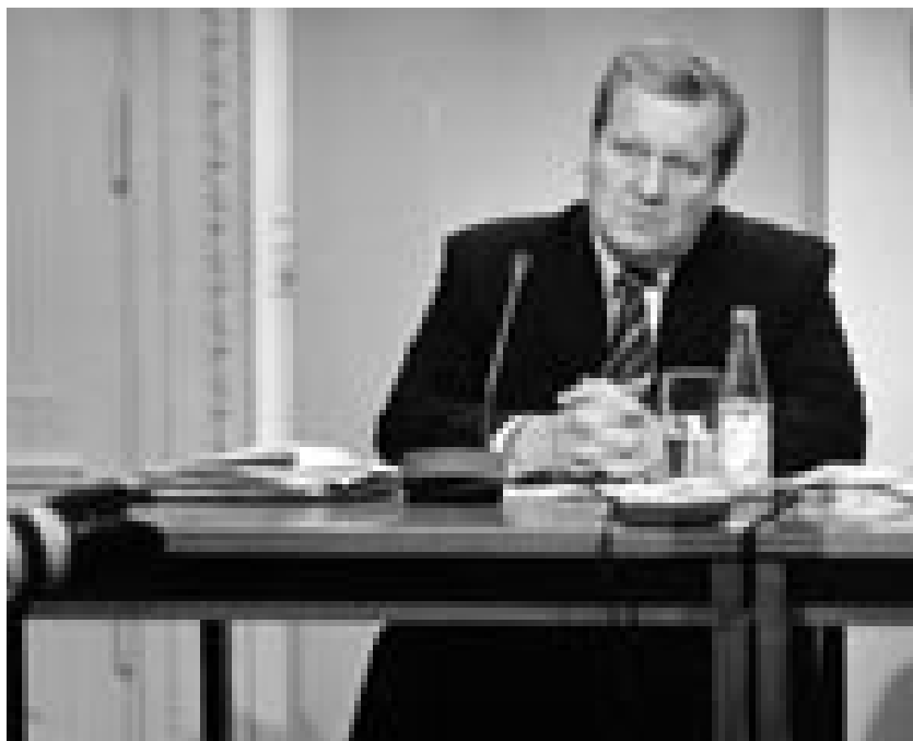
Skatteminister Svend Erik Hovmand optrådte bemærkelsesværdigt arrogant

Den nye lov er en udvidelse i forhold til tidligere, hvor skattefradraget blev bevilget til samarbejdsprojekter mellem