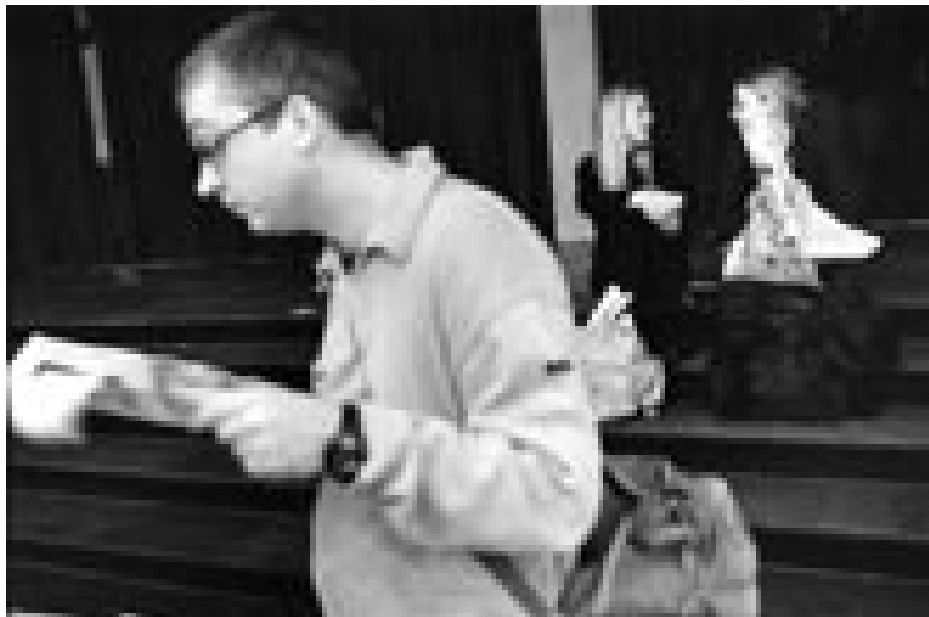
Kan man tale om kvindelige værdier, når man skal karakterisere udviklingen i universitetskulturen?

- Men undervisningsformen har jo ændret sig betragteligt i de seneste 30 år. Skyldes det kvinderne?