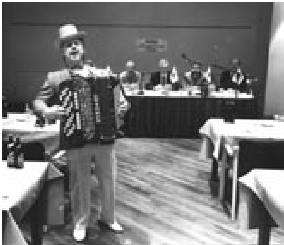
Når forskere synger en sang i offentligheden, skal de være klar over, at dommere kan snuse dem i nakken ....