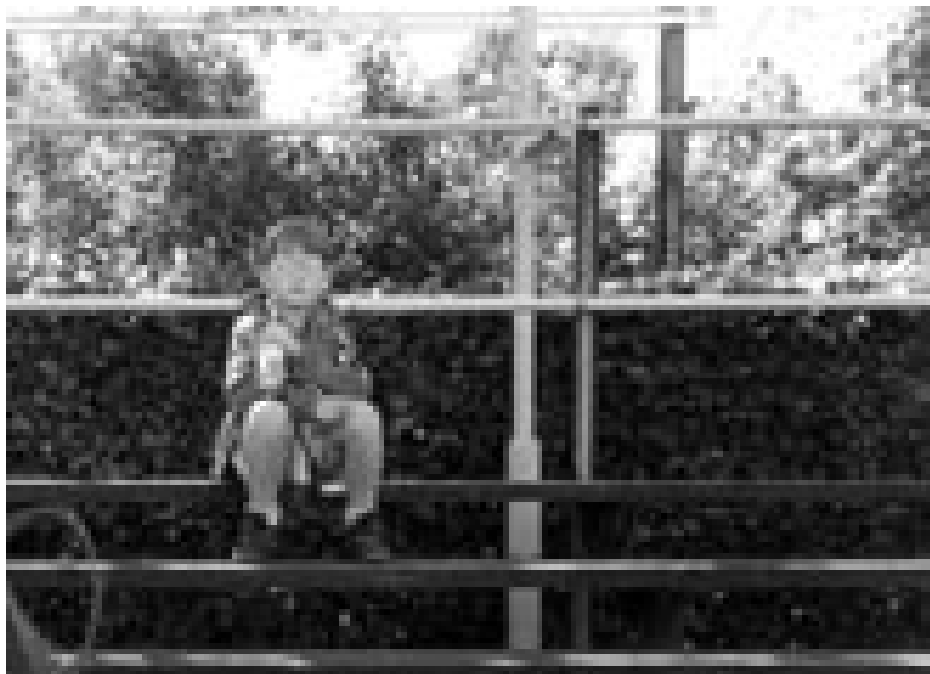
Forskertalenterne sidder helt alene på tilskuerpladserne og venter ...

Men en ting er, at der er stort talentspild, men et andet – og mere nærværende problem for universiteterne – er, at