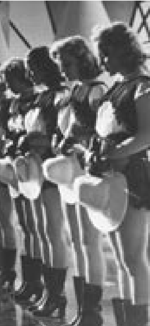
OECD kræver, at universiteterne danser mere i takt med kravene i samfundet og i samfundsøkonomien ....