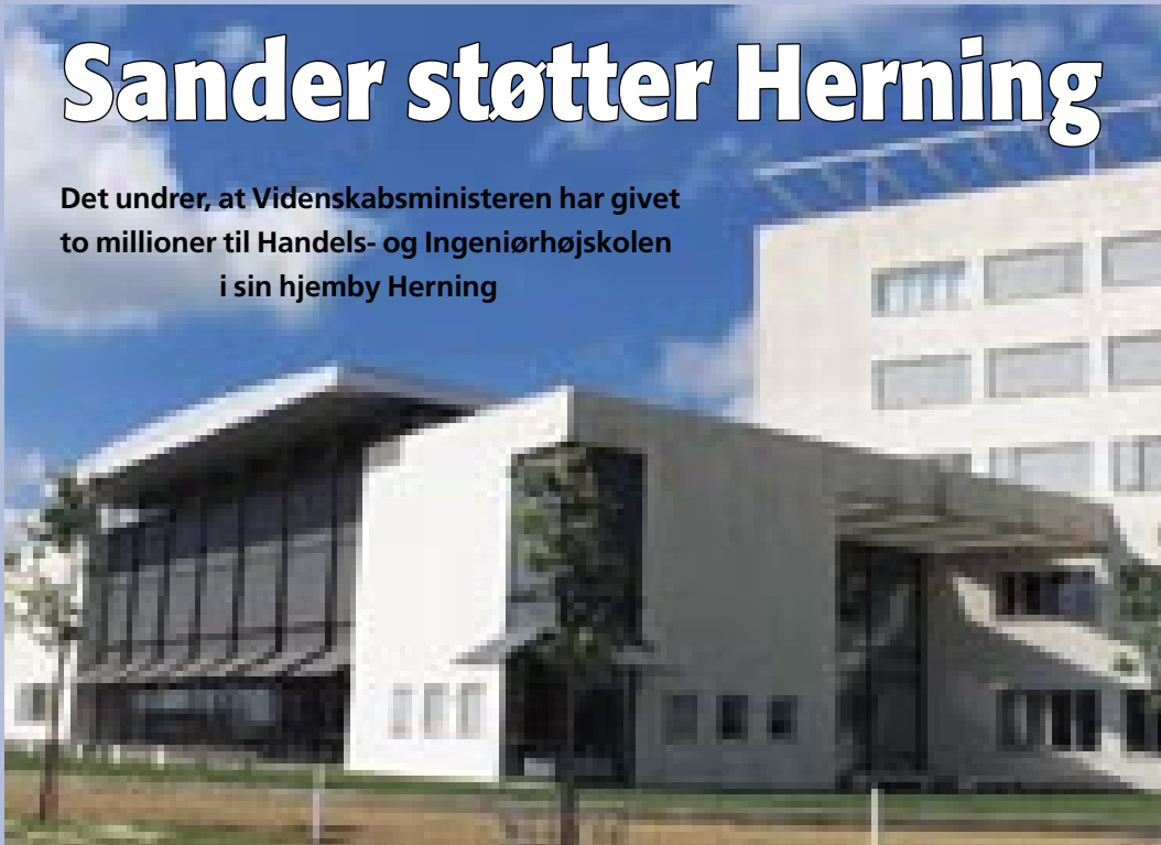
Handels- og Ingeniørhøjskolen i Herning

Det undrer, at Videnskabsministeren har givet to millioner til Handels- og Ingeniørhøjskolen i sin hjemby Herning