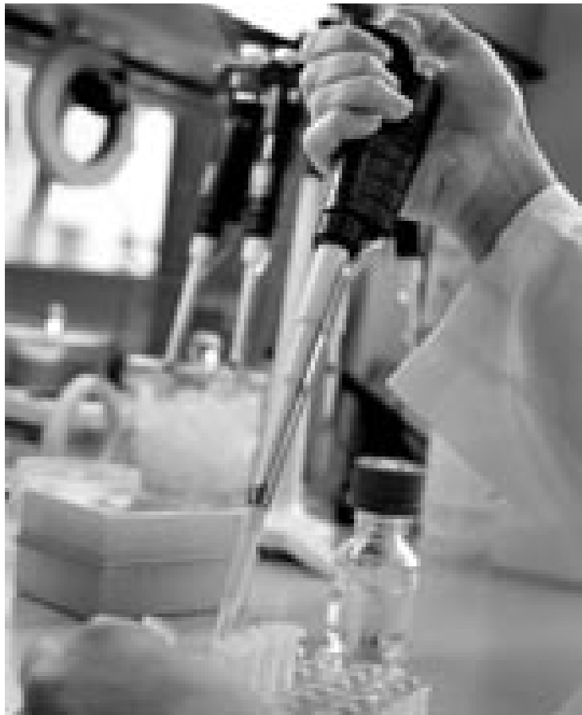
En ressortminister fortsat vidtrækkende beføjelser til at blande sig i institutionernes arbejde og prioriteringer. En miljøminister kan fx diktere ændring af miljøtest, overvågnings- og myndighedsopgaver - men kan også styre forskningen gennem resultatkontrakten

rammer og emnekredse for institutionens forskning, mens bestyrelsens konkrete udmøntning af, hvorledes forskningen tilrettelægges og gennemføres, sker uafhængigt af ministeren. Når institutionen altså igangsætter forskning på et bestemt felt har ministeren imidlertid ingen instruktionsbeføjelser i forhold til ”forskningens resultater”, og ministeren kan ikke påbyde den enkelte institution at optage eller undlade en bestemt forskning, hedder det.