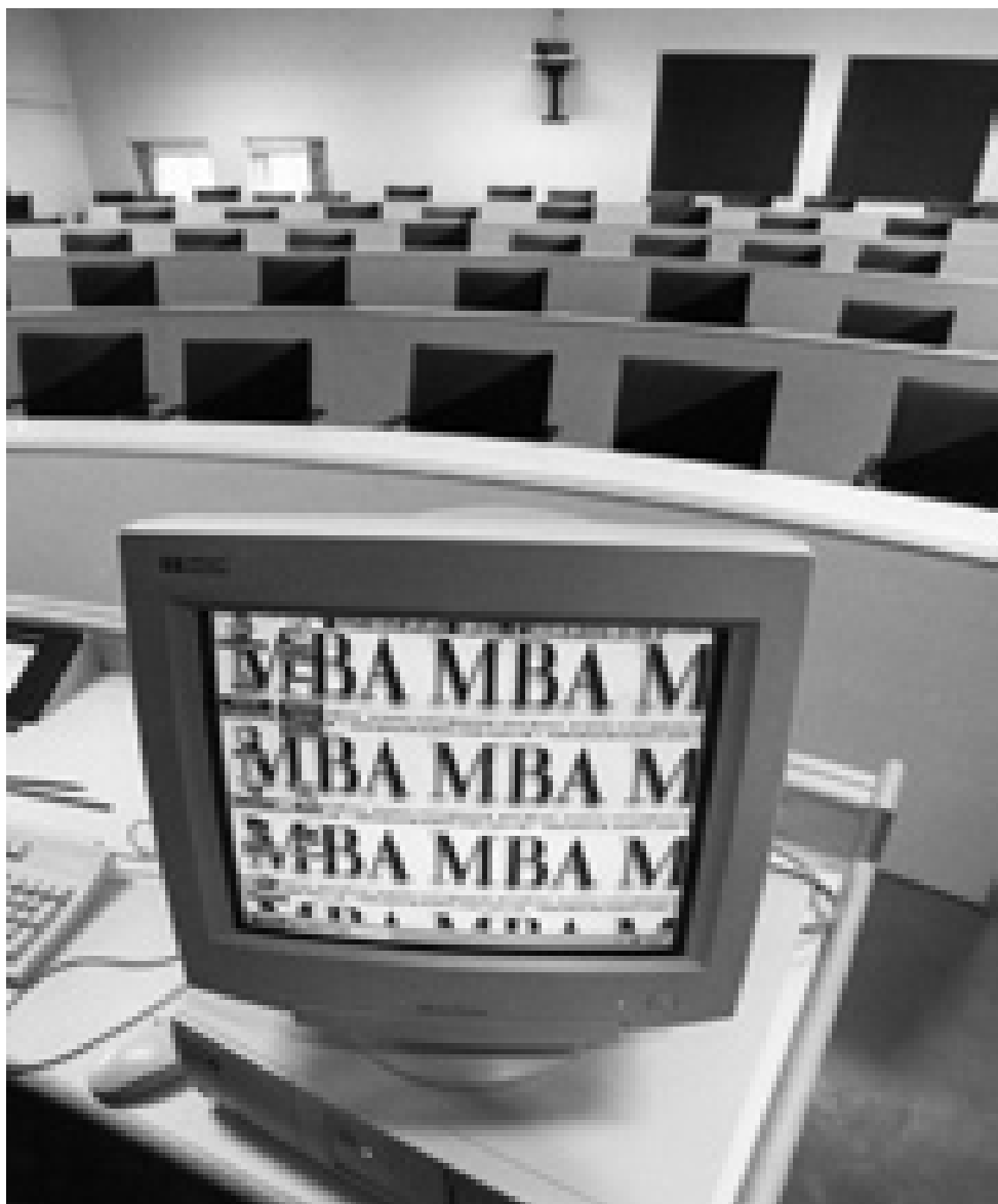
Arkivfoto. Masteruddannelserne var starten i slutningen af 1990'erne kilde til misundelse, fordi MBA-studerende blev forkælede med de bedste faciliteter. Den forskelsbehandling er udlignet udlignet noget siden CBS' flytning til nye lokaler

"Men det er vilkårene på det marked. Satsningen blev vedtaget af Konsistorium med åbne øjne. Det var en politisk satsning at starte en fuldtids-MBA-uddannelse op; Konsistorium vurderede, at det var nødvendigt, hvis CBS skal konkurrere og profilere sig på det internationale marked. Det er en investering i udvikling af uddannelsesstilbud. Og det er nødvendigt med disse 'executive'-uddannelser, hvis CBS skal være en attraktiv