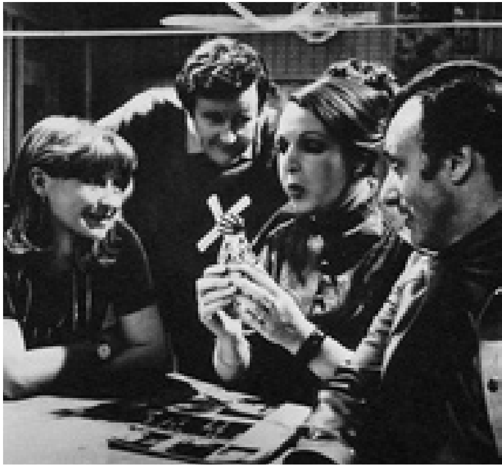
Snart må sektorforskningen til at lave forskning, som ikke koster penge ...