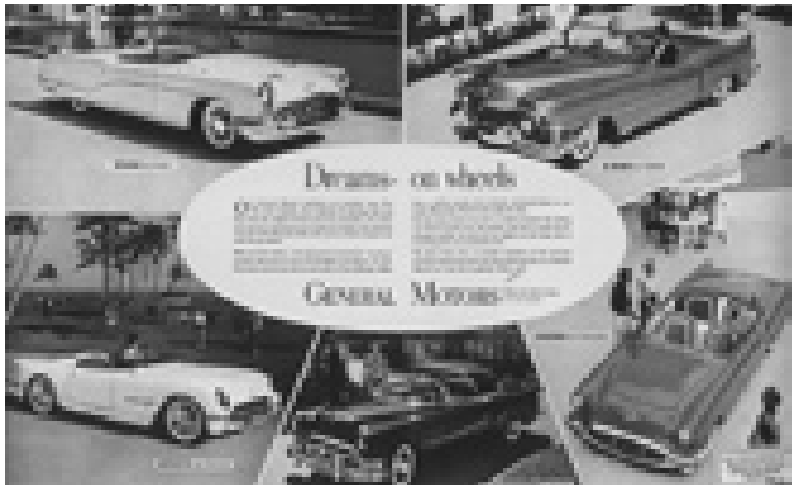
Advarsel. Køb ikke dollargrin i forventning om ekstra penge fra Ny Løn ...