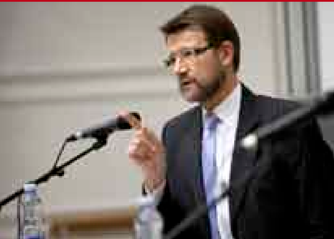
Videnskabsministeren er ude med direktiver og pegefingern i denne tid. Her da han mødtes med KUs studenter til debattmøde d. 10. okt.