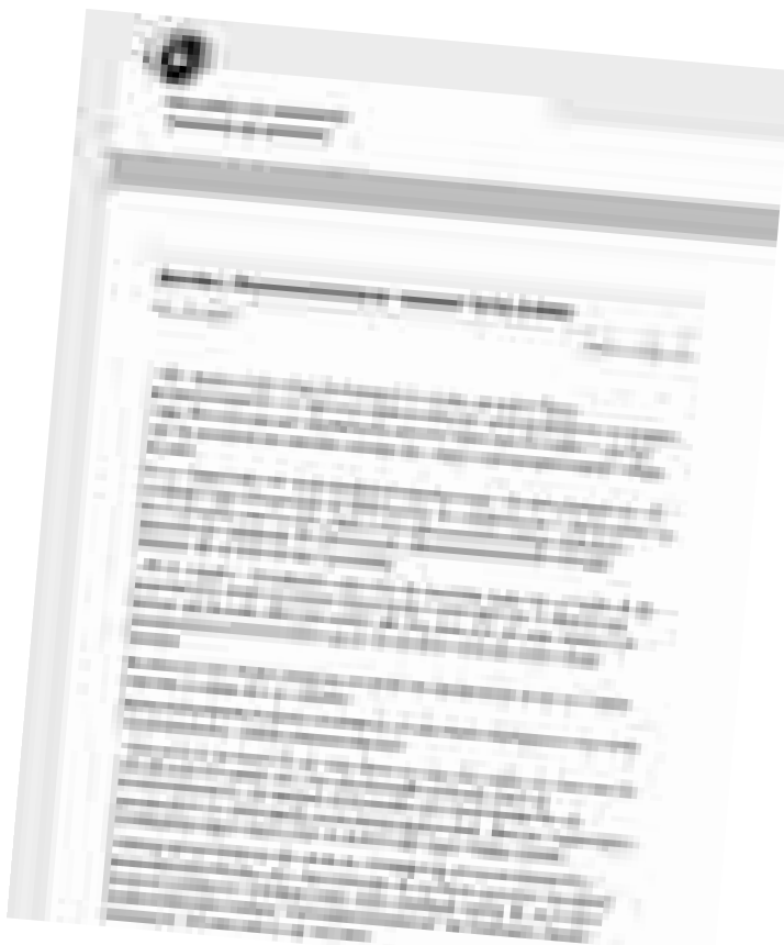
Videnskabsministeren gik hårdt til studenternes grundlag for at demonstrere mod finansloven. Han udsendte to pressemeddelelser: "Demonstrationer skyder forbi målet" og "Forfejlet grundlag for demonstrationer" (se VTU.dk's nyheder d. 1-2. oktober)

"Denne talkrig er helt uproductiv. Lægemand og vælgere i dette land har ikke en chance for at forstå uenigheden. Men man kunne vel forlange, at debatten baseres på fakta. Og jeg er altså nødt til at gå ind, når der fremlægges oplysninger om uddannelsesbevillinger, som ikke er korrekte".