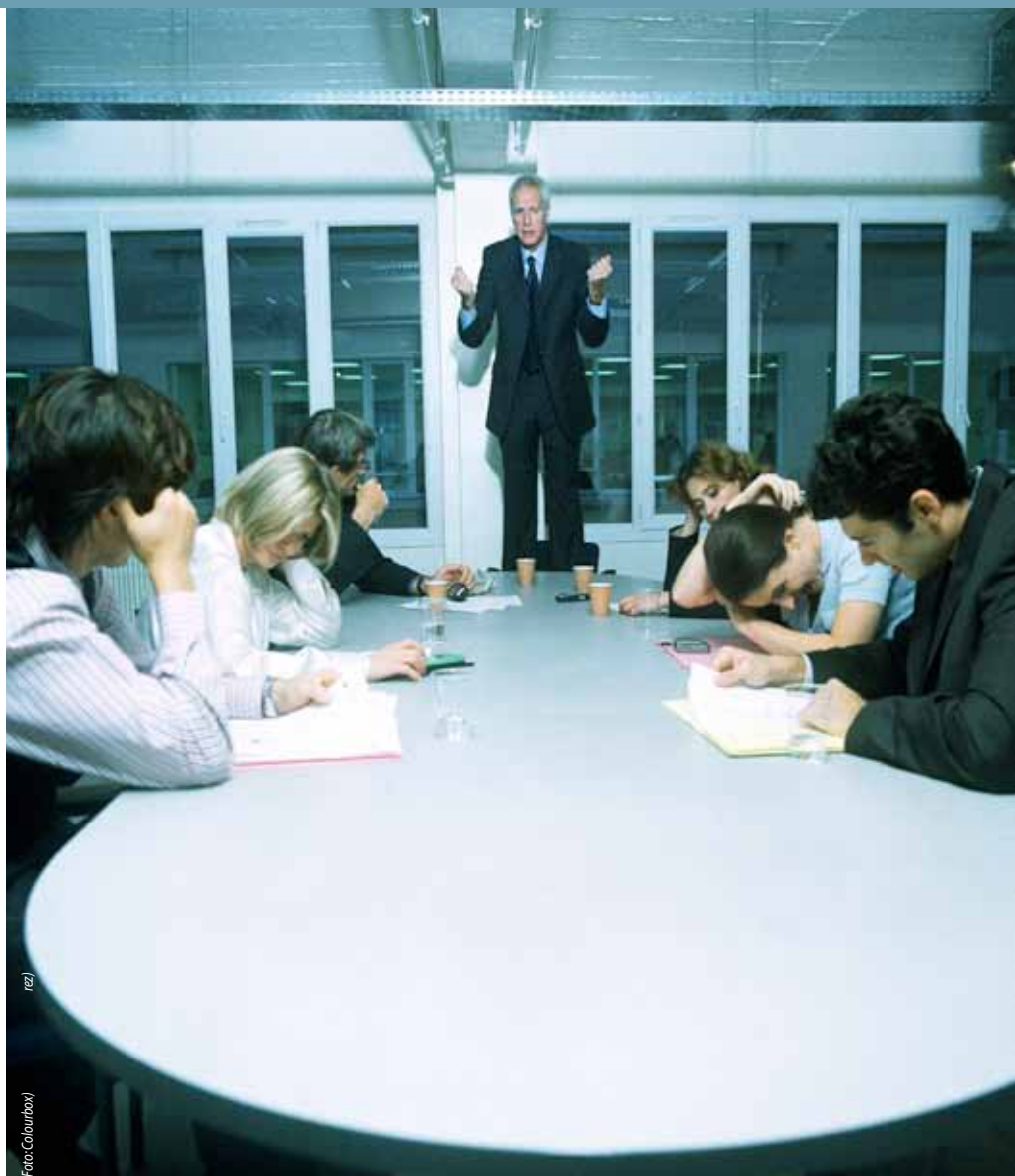
Akademikere elsker at snakke, og de kan gøre det i timevis, hvis ikke de bliver stoppet af en kompetent mødeleder.

”Den videnskabelige kultur har alle år været af kritisk rationel karakter, med streg under kritisk. Forskningens adelsmærke er, at man ikke bare tager det andre siger for givet – man stiller spørgsmålstegn, og det præger forskerens måde at kommunikere på. Og det kan kolliderer med den samarbejdslogik, der burde herske. Når en leder kommer med et udspil, vil den første impuls således være: Gad vide hvorfor det, min leder siger ikke er godt nok?”