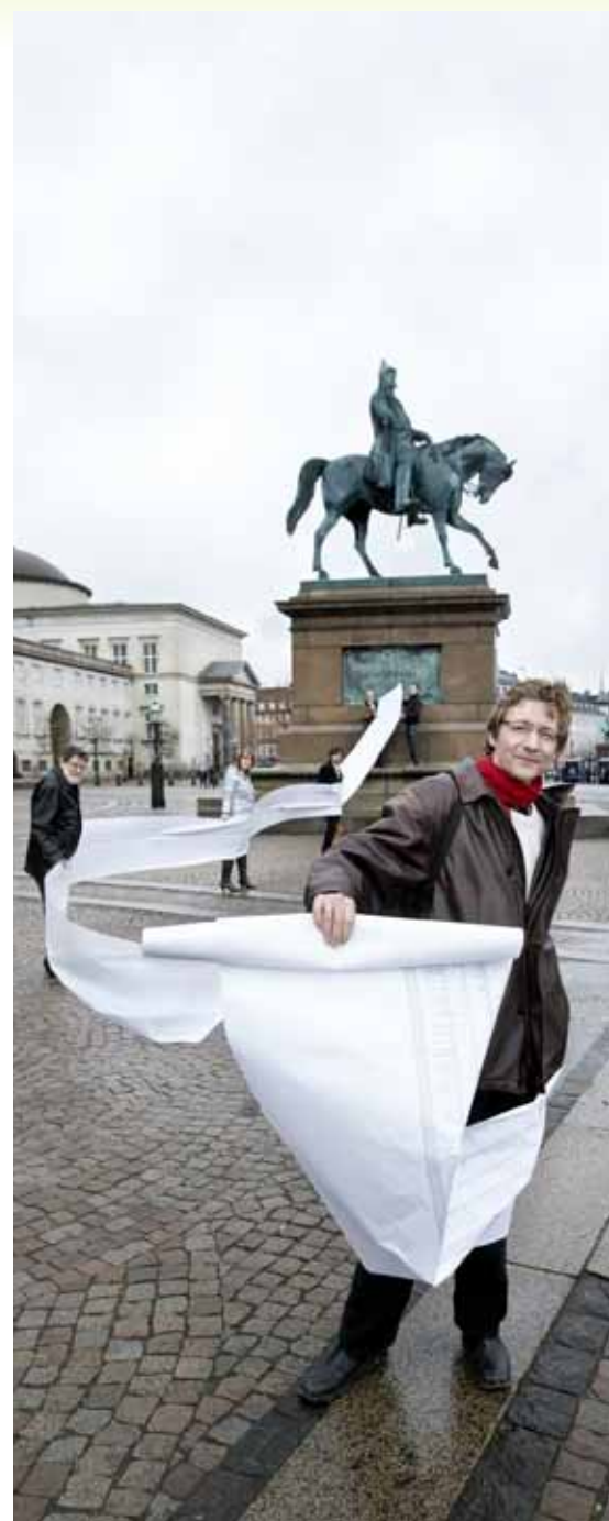
Sådan så rullen med 6.488 underskrifter ud, da den blev indleveret til videnskabsudvalget i november 2008.

"Men jeg har ingen illusioner om S' velvilje over for uni-demokratiet eller de ansattes medbestemmelse. Det viser alliancen med regeringen om lovrevisionen", konstaterer han. "Hvad angår uni-demokratiet er der tilsyneladende lagt til kollision. Det er indlysende, at S' styringspolitik er i modstrid med SFs og Radikales demokratiopfattelse. Begge partier har været stærke modstandere af den 'politisering' og topstyring, som Uni-Løven er udtryk for, selv om SFs ordførere i de senere år har blødt op på deres tidligere skarpe holdninger. Så det hamrende interessante bliver, hvem af de tre parter, der først bøjer sig