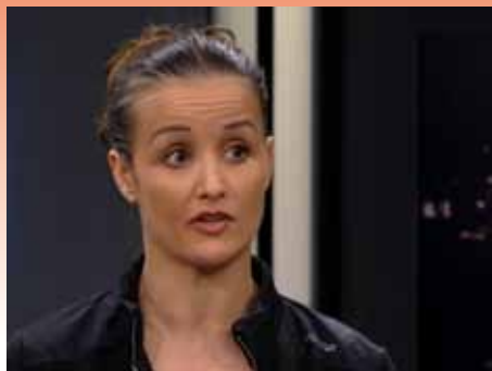
Penkowa 2: Rotterne og eks-dekanens rolle

Truslen om sagsanlæg præger også KUs jurister. De er utroligt forsigtige med at udlevere sagsmateriale om sagen, fordi det vedrører en personalesag. Og rektor er – formentlig efter råd fra sine jurister – utroligt forsigtig med at udtale sig. Han henviser til, at personalesager er fortrolige.