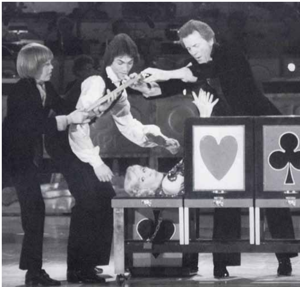
Illusionstrylleri: Når forskere tvinges ned i tid som den oversavede dame