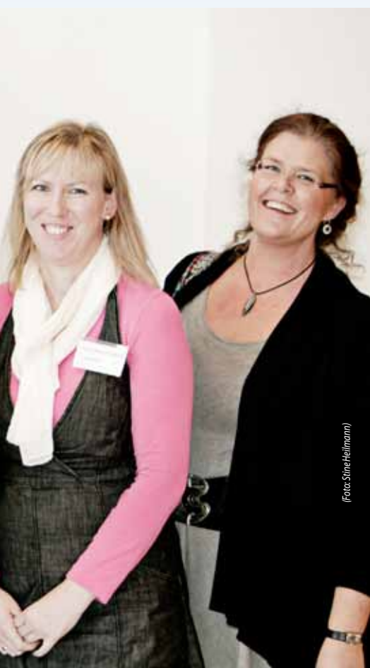
ne kolleger ved overrækkelsen af prisen som Årets personaleleder i staten, 2010.

es tid. Og forebyg åndssvage ordrer fra topledelsen