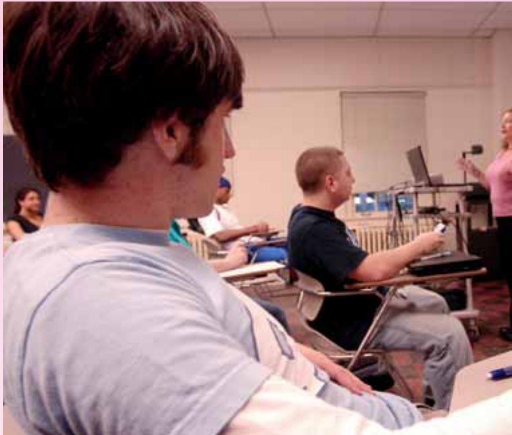
Undervisning med brug af clickers er blevet en del af