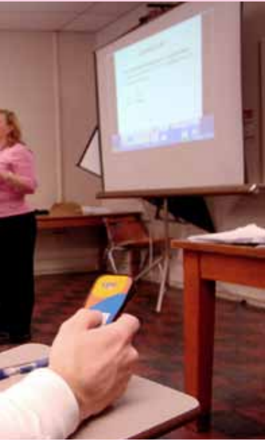
af hverdagen på amerikanske universiteter - her på University of North Carolina.

i de studerende egen interaktion, siger KU's mest erfarne clicker-underviser