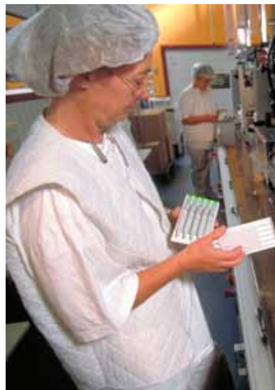
Novo Nordisk tjener formuer på sin insulin-produktion - o

Han fortæller, hvordan de store kapitalind-