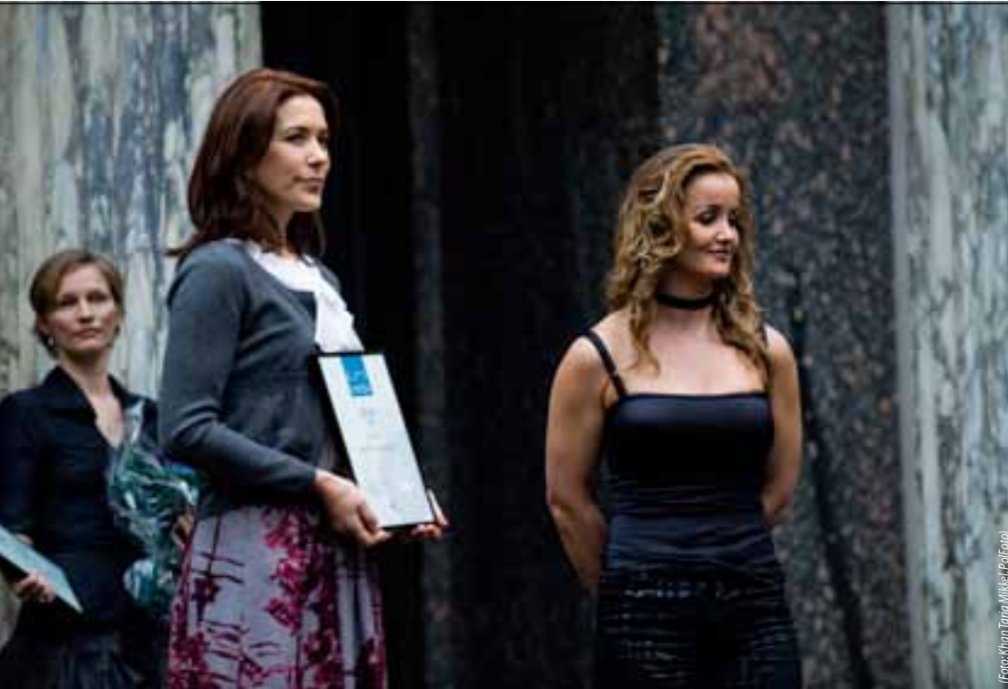
29. januar 2009. Kronprinsessen overrækker EliteForsk-prisen til Penkowa. Siden er de blevet omtalt sammen 123 gange.

Udgiveradresseret maskinel magasinpost id-nr.: 42026 Alt henvendelse: dm@dm.dk, telefon 3815 6676