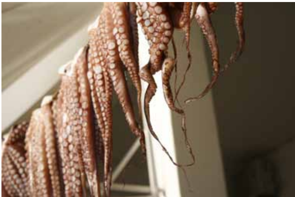
Uni-lærere skal være som mangearmede blæksprutter – nogle gange er de bare så uheldige at blive ophængte.

Han betragter udspillet om mere løse rammer som et forsøg på at presse flere "skjulte