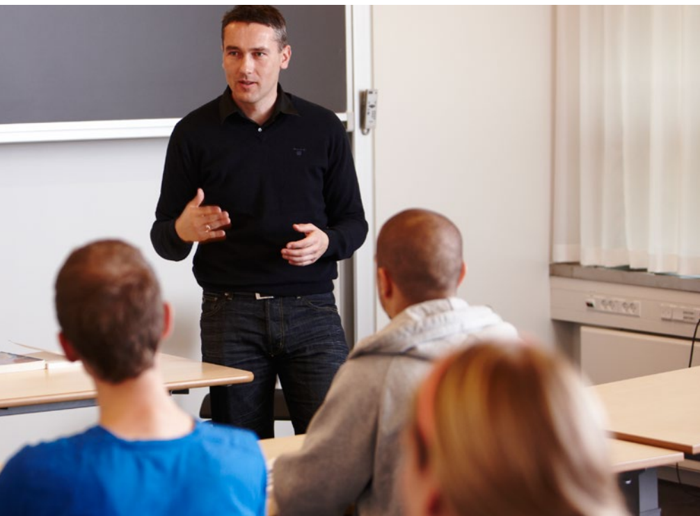
De studerende forventer autenticitet i undervisningen, så det er vigtigt, at finde en underviser-stil, der ligger godt til ens personlighed.

man kan se nogle tegn på, at incitamentsstrukturen, der traditionelt favoriserer forskningen, står for fald. Når man begynder at tale om undervisnings-professorater, så er det i mine øjne et tegn på opbrud. Det næste må blive, at man kigger på studielederjobbet, og sørger for, at det ikke bliver en akademisk stopklods,” siger Tofteskov.