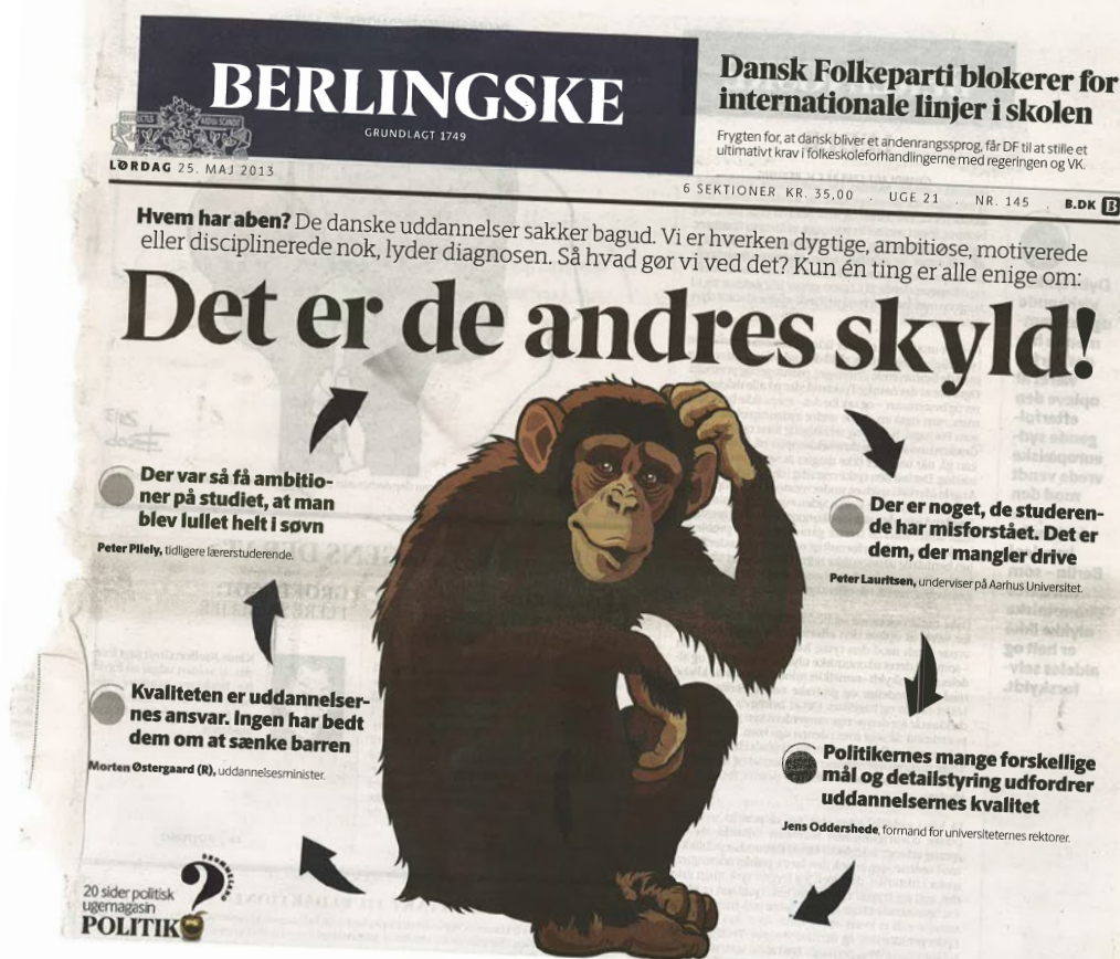
BERLINGSKE rundede et ugelange tema om krisen i det danske uddannelsessystem af med et forsidespørgsmål: Hvem har aben? BERLINGSKEs resume var, at alle implicerede sender ansvaret videre...

"Jeg fortolker ministerens 'kulturrevolution' sådan, at der pt. uddannes for mange, og at han påstår, at problemet er, at uni'erne har uddannet forkert! Det får så opbakning hos arbejdsgiverne, som hævder, at man mangler kvalificeret arbejdskraft. Men det er forkert at løse problemer ved at pålægge uni'erne nye krav og forpligtelser. Og det er forkert at gøre uni'erne til syndebukke, for der er rigtig mange medansvarlige: Politikker, politikere, lavkonjunktur, arbejdsgivere, uni'er mm.", svarer rektortalsmanden.