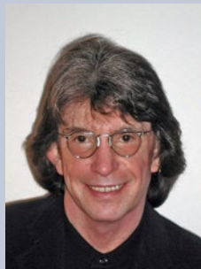
Professor Henry Giroux

for teorier om bureaukratiets magt – sagde, at Academics må stå frem og mobilisere, når demokratiet er truet. Jeg forstår mekanismerne bag, at mange Academics forholder sig passive, men jeg har ingen sympati for dem, for de flygter fra deres forpligtelse og ansvar”, siger han. ”Tak Vorherre for dygtige og kritiske journalister. De graver sager frem og rejser vigtige spørgsmål – de gør det, som Academics i langt højere grad burde gøre ...”