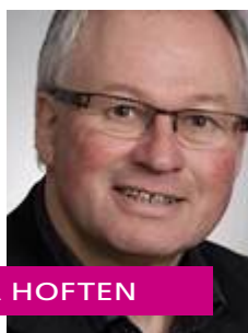
SKUDT FRA HOFTEN

”Retfærdigvis synes jeg dog overordnet set, at jeg ikke skød helt forkert, da jeg allerede i januar vurderede, at der ville blive