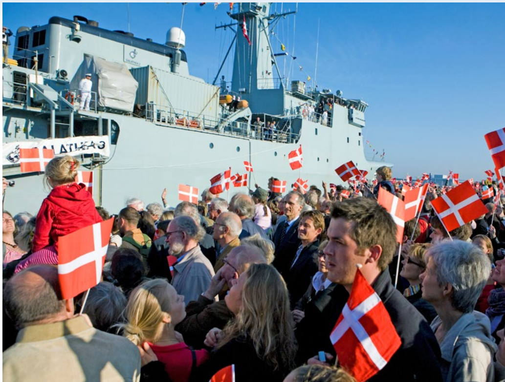
MEDIEHYPE i april 2007: Galathea3 anløb København efter i 8½ måned at have sejlet Jorden rundt. Det blev lanceret som en stor national begivenhed med flag og musikledsagelse. Ved ankomsten ventede bl.a. kronprins Frederik, undervisningsminister Bertel Haarder (V) og videnskabsminister Helge Sander (V) og mange pårørende.

Galathea-ekspeditionen er langt fra et enestående tilfælde. Bladet Ingeniøren kunne for to år siden berette, hvordan 11 projekter fra togtet søgte om bevillinger til efterbehandling af data, men ikke fik penge.