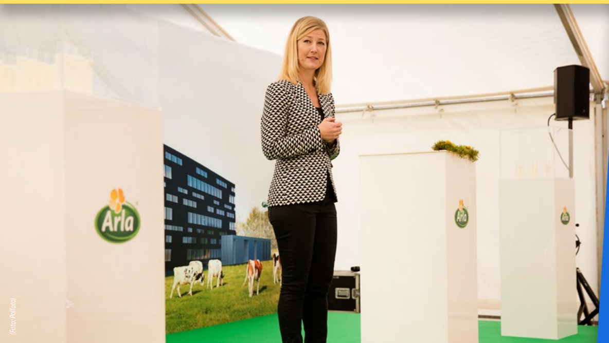
Sofie Carsten Nielsen tog det første spadestik til Arlas nye innovationscenter d. 6. oktober i Aarhus