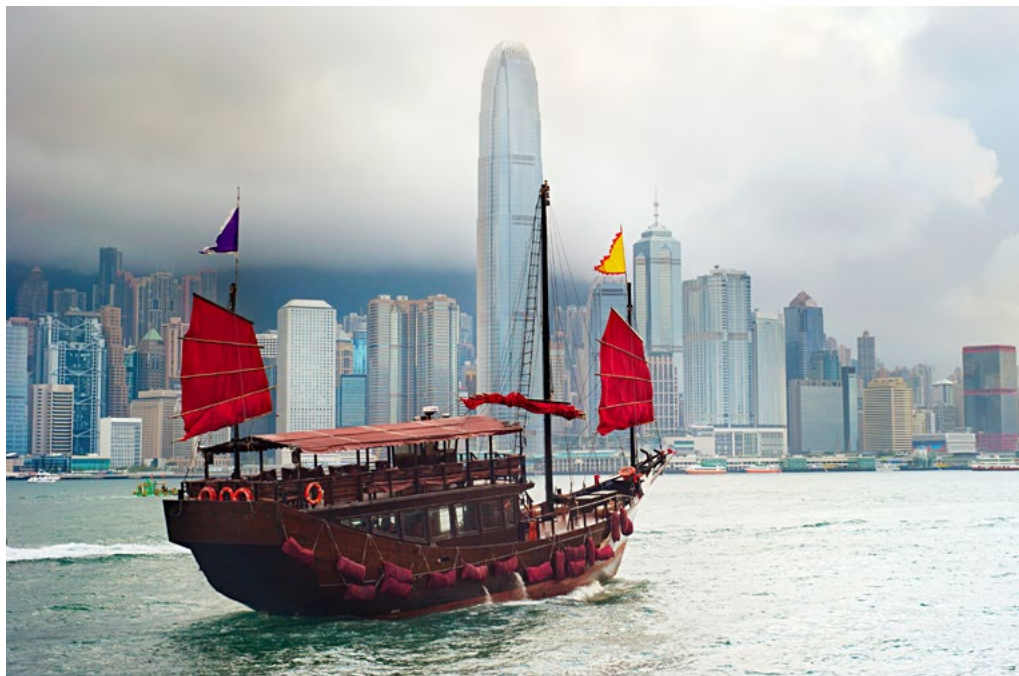
Kina er et land i konstant vækst, også på forsknings- og uddannelsesområdet.

"Obama fortæller fornøjet og interesseret premierministeren om et besøg på en kinesisk skole, hvor de studerende sidder og er meget flittige, og bemærker, at de ligner små Harry potter'e. Men til det svarer premierministeren, at han havde foretrukket, at de havde lignet små Steve Jobs'er. Præmissen for historien er den kinesiske forestilling om det vestlige uddannelsessystem, der udvikler