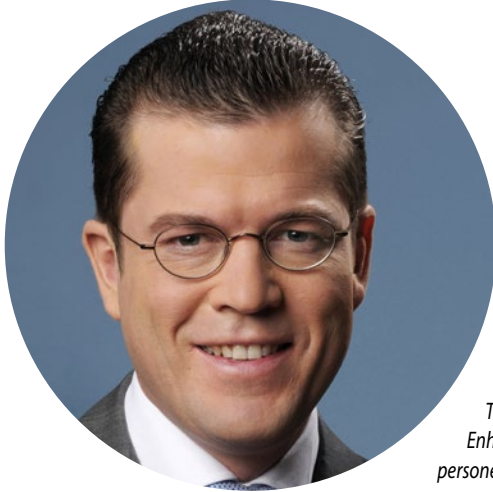
Her ses eks-minister Karl Theodor Zu Guttenberg. Enhver lighed med andre kendte personer er utilsigtet.