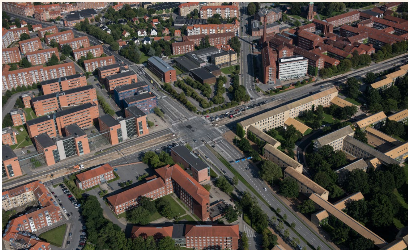
AU har købt Kommunehospitalet, som ses øverst til højre på fotoet.

- ved at købe Kommunehospitalet i Aarhus. Nu skal køb og husleje så bare godkendes af Finansministeriet