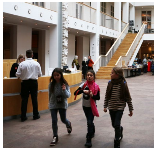
Der er ikke grund til at bekymre sig for de kommende forskergenerer.

at vi bruger halvanden mio. kroner af en ph.d.-bevilling til løn for de studerende, så falder de ned af stolen. Vi forgylder vores ph.d.-studerende. Jeg ved det fra mit eget ph.d.-forløb. Jeg tog til udlandet og levede som en konge i forhold til de andre ph.d.-studerende. Hvis man investerer relativt meget, bør man have et afkast, der er større. Og i det lys er det, at vi blot er på niveau med udlandet, måske ikke helt godt nok.