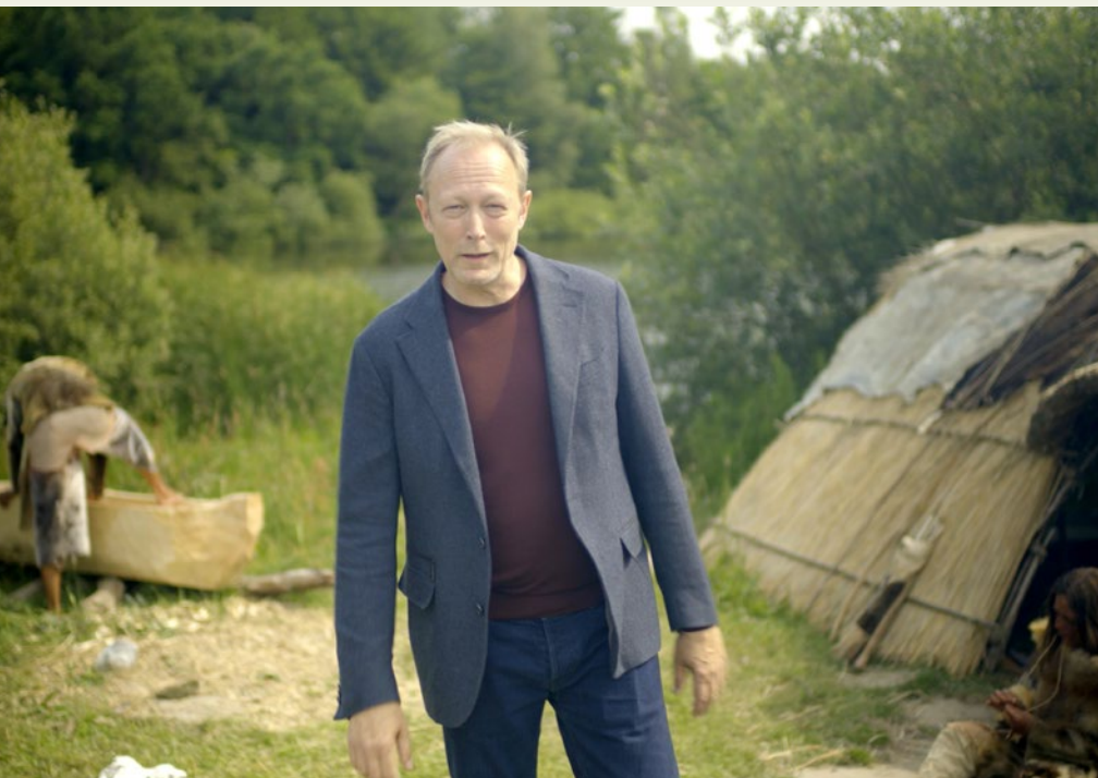
Selv om det kun er korte sætninger, der kommer ud af munden på Lars Mikkelsen i Historien om Danmark, er der gået en lang proces forud, som en række forskere har været indblandet i.