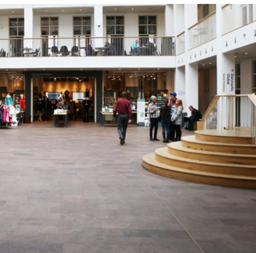
ationer, fastslår Ph.d.-evalueringsrapporten, der blev diskuteret ved en konference på Nationalmuseet.

antydte han alligevel kraftigt, at danske ph.d.-studerende halter efter niveauet i flere af vores nabolande – særligt dem med længere ph.d.-forløb.