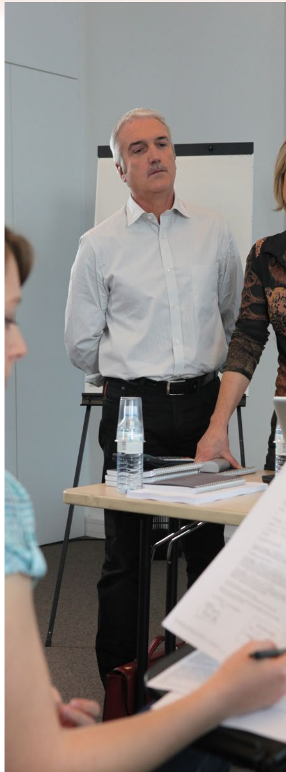
Det gør ikke nødvendigvis bedømmelsen bedre, at man bruger eksterne censorer. Ofte kan pengene bruges bedre, siger Censorudvalgets formand.

Han gør dog opmærksom på, at man stadig vil fastholde ekstern censur på uddannelsernes afsluttende store opgaver, eksempelvis bacheloropgaven.