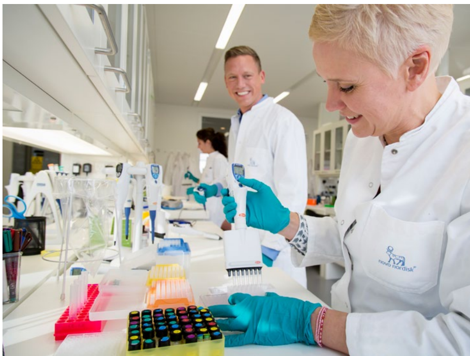
Novo Nordisk kan ånde lettet op - de danske ph.d.'er kan sagtens måle sig helt med de udenlandske. Her Novo Nordisks afdeling for fedmeforskning i Måløv.