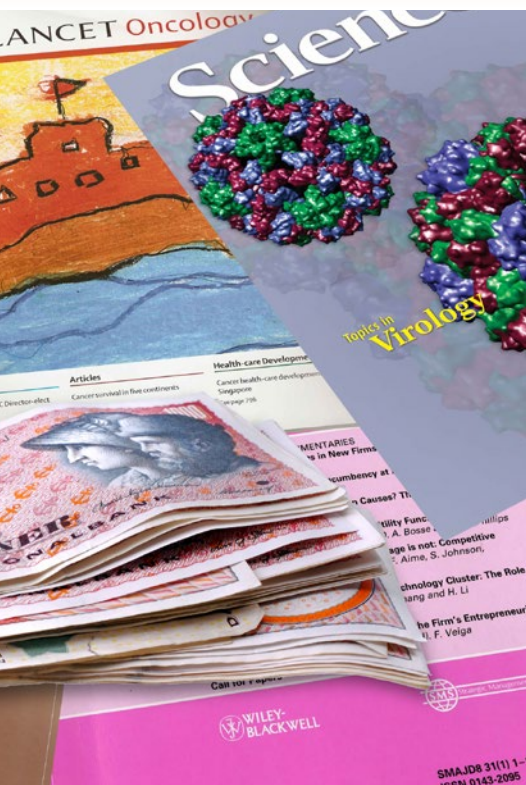
i et anerkendt, internationalt tidsskrift. På mange institutter giver det kontakt udbetaling ved kasse 1.