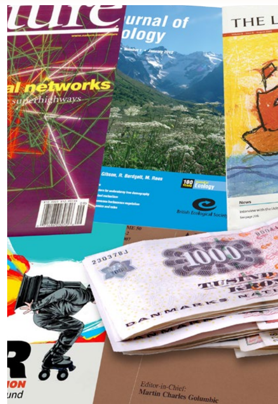
Det er ikke kun prestige og CV-guf, når man lander en publicering

Fællestillidsmand Ole Helmersen er med til at udpege de ”heldige vindere”.