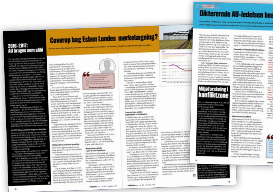
FORSKERforum har løbende fortalt om problemer i koblingen mellem myndigheder og forskning og om forskere i store klemmer. Her er de to seneste eksempler.

"Trods de mange sager har AUs ledere hidtil benægtet, at AU har problemer med Miljøministeriet eller at AUs miljøforskere skulle være under pres. De lukkede øjnene, de afviste kritisk omtale som 'konspirationer' og håbede øjensynlig, at omtalen ville gå i sig selv igen. Hvad den altså ikke gjorde, fordi der hele tiden dukker nye konflikter op".