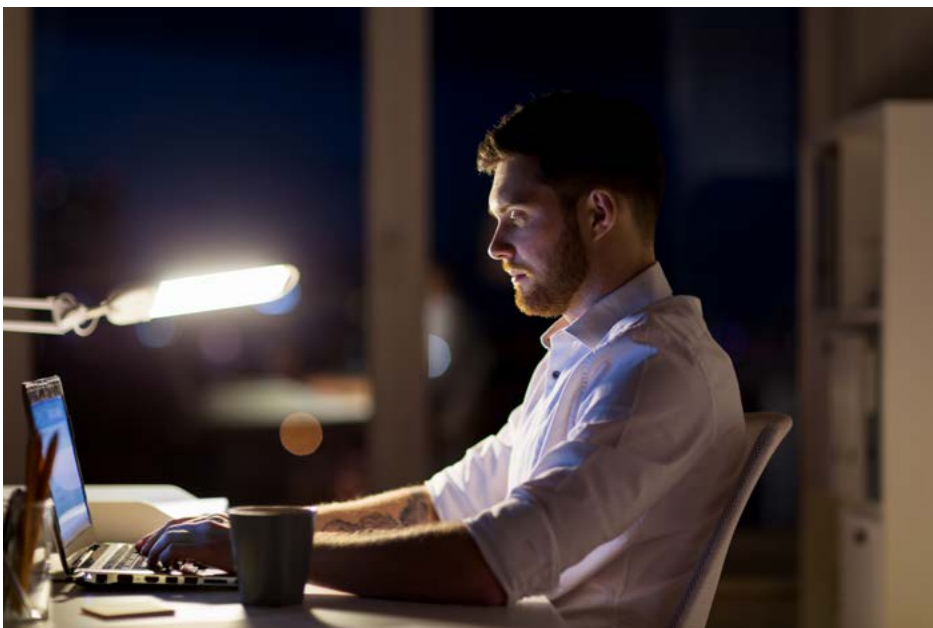
Der bliver arbejde til de sene aftener for mange forskere, der på grund af den nye persondataforordning er blevet bedt om at gennemgå gamle emails, man har liggende i mailsystemet.

”Jeg tror ikke, man skal bekymre sig så meget for at få den største bøde, hvis man har gjort en ærlig indsats for at prøve at leve op til reglerne. Det, man skal være bekymret for, er, at medierne finder en fejl, de kan lave en historie på, eller at de personer, man har registreret, klager. Jeg ved, at vores DPO ( data protection officer, red. ) forbereder sig på at de første 20 jurastuderende kommer med en klage her efter 25. maj.”