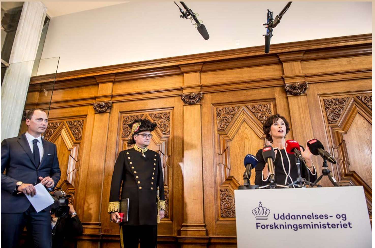
MINISTER-OVERDRAGELSE 2. maj. Departementschef Agnete Gersing hylder den afgangende minister Søren Pind og den nye, Tommy Ahlers