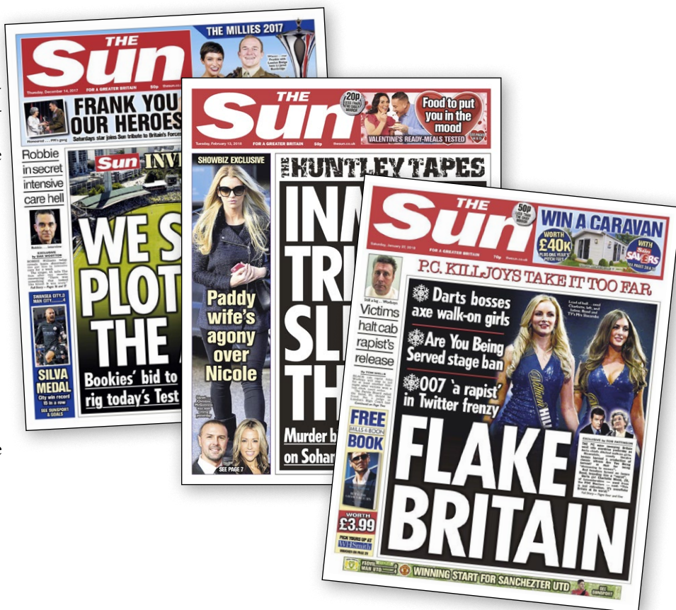
Tabloidavisen The SUN overgår langt danske BT og Ekstra Bladet i sensationer og pop og er kendt som meget højreorienteret og for at støtte Brexit og klima-benægtelse. Men nu skifter avisen signaler...

Husk lige, at i de første FN-klimarapporter i maj 1990 byggede hele