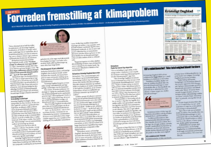
FORSKERforums artikel fra oktober 2017, som udløste den første klage fra Pepke. Pepke fik ret i, at FORSKERforum skulle have hørt ham om klimaforsker Katherine Richardssons karakteristik af ham. Men FORSKERforum fik ingen påtale for at kalde ham "klimaskeptiker" eller "tilhørende de 3 pct.s klimaskeptikere" - og det har udløst nye klager...