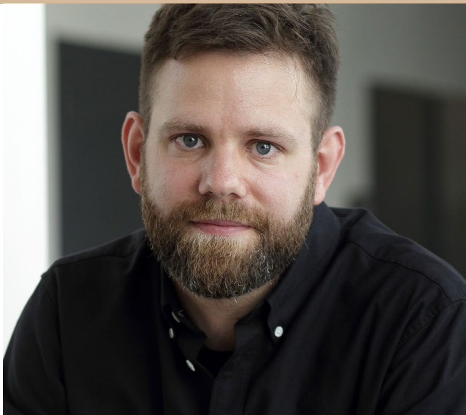
Sproglige feltstudier blandt indvandrerdrøge i en lokal folkeskole var stort set lige så eksotisk som en tur i Regnskoven, fortæller Andreas Stæhr.

”Det var en norm, at man helst skulle have minoritetsbaggrund for at have ret til at bruge den her stil. Det kunne jeg eksempelvis konstatere på Facebook. En dreng skrev, at han havde barberet sig. Så skriver hans ven, som er en griseфарvet dansker: ”så har du ikke mere shark tilbage” – altså hår. Og det fører til flere indlæg om, at han nok tror, han er perker. Det hele er for sjov, men det siger noget om normen.”