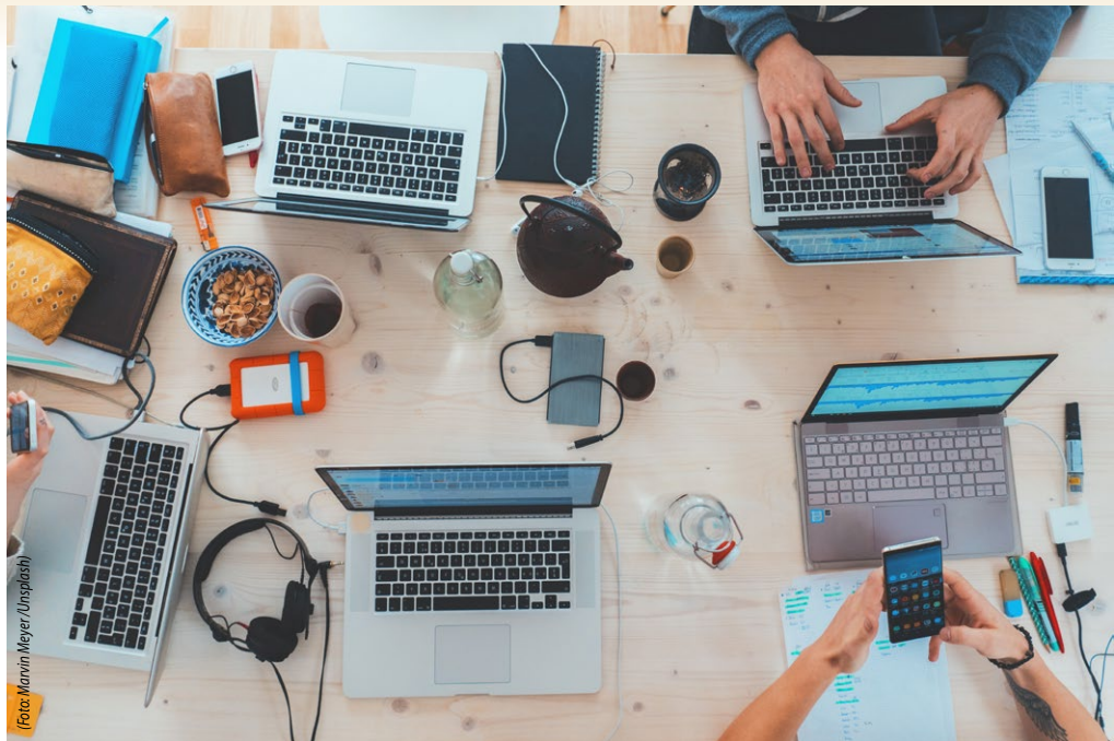
Skrivevelser kan være en god måde at sætte gang i refleksionen, ikke mindst for nye studerende, der skal arbejde sig ind i faget.

Ulriksen foreslår også, at man som underviser bruger en smule tid på at finde ud af, hvilke studerende, det er, man har foran sig.