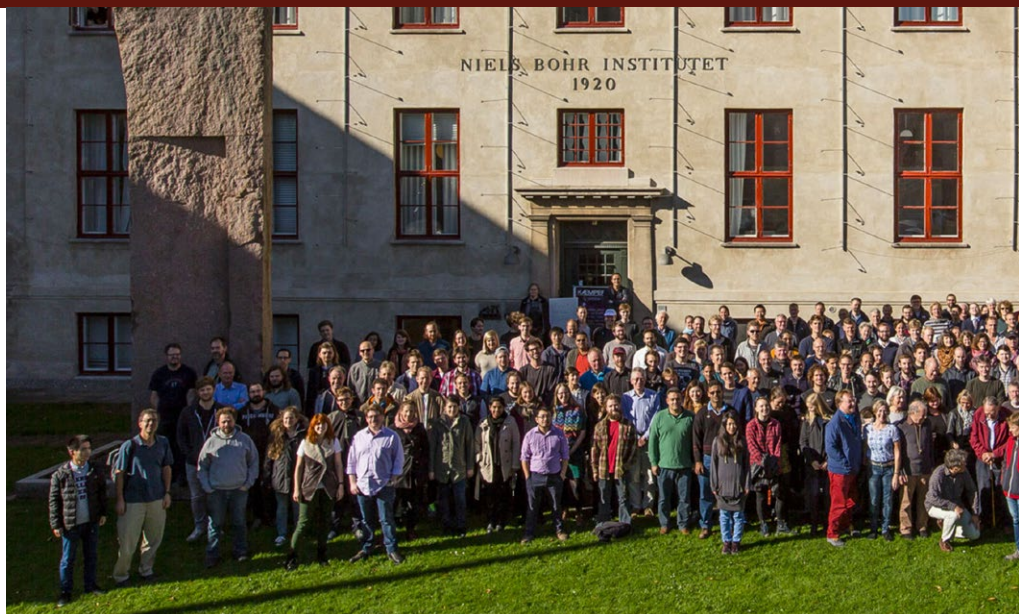
NBIs officielle personalefoto 2017. Der vil mangle nogle kolleger på det næste foto...

Kontraktens bastante indlejningskrav har kun været kendt af bevillingshaver, institutledelse og fonden, så det har ikke været forelagt på instituttet eller tillidsmanden og er derfor heller ikke indgået i strategiplaner.