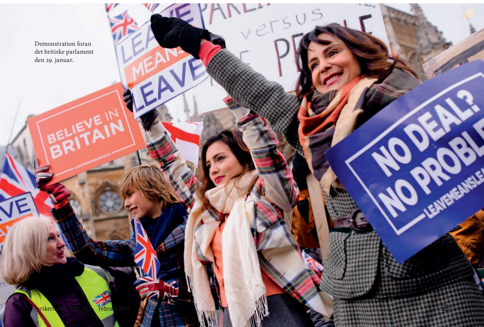
Demonstration foran det britiske parlament den 29. januar.

Oversat og redigeret fra Times Higher Education 20.11.2018