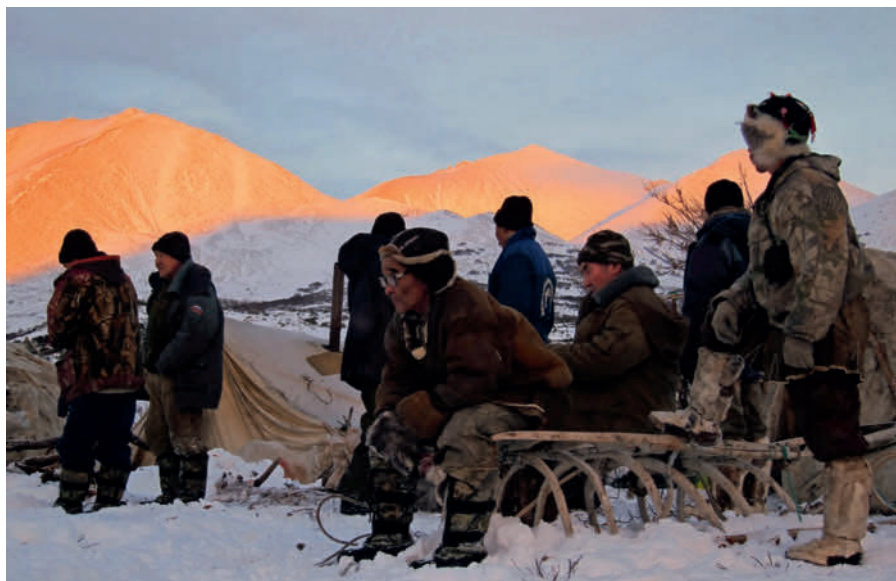
Tjukterne er et gammelt normadefolk, men siden sovjet-tiden har kvinder og børn boet i landsbyer, mens mændene passede rendyr på tundraen.

Hun forklarer, at tjuktjerne i Rusland er omgærdet af mange fordomme på grund af deres problemer med alkoholisme, lidt som det herhjemme i nogen grad gælder for den oprindelige grønlandske befolkning.