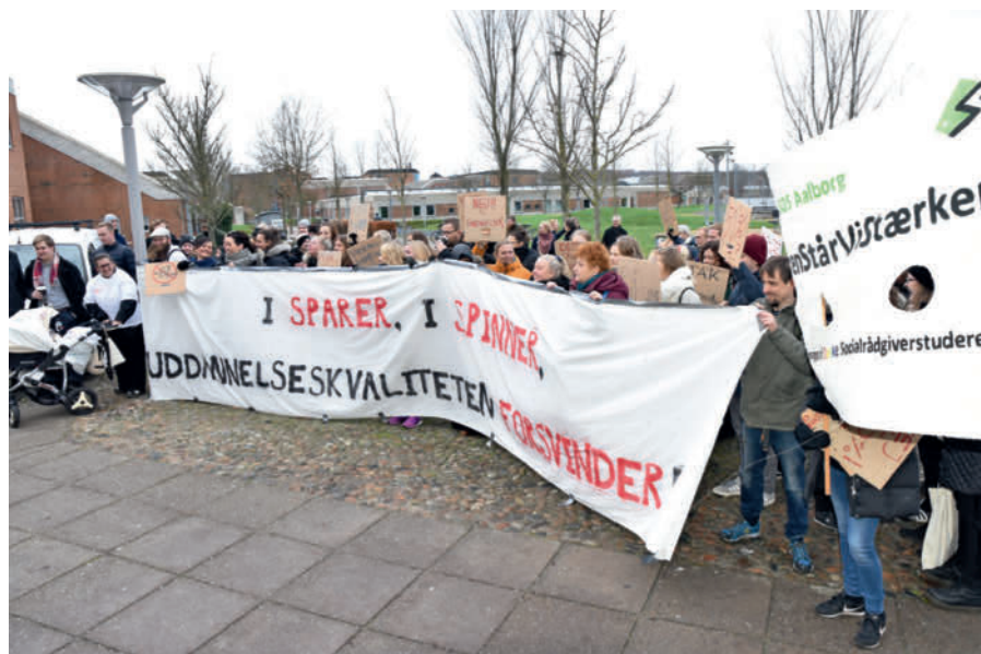
Rektor blev mødt af demonstranter på vej til medarbejdermøde om spareplanerne i december sidste år.

Tillidsrepræsentanter oplever frustration blandt medarbejderne over ikke at kunne få oplyst, hvorfor de blev prikket.