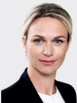
Merete Riisager, Liberal Alliance:

Uddannelse er et hedt debattemne blandt politikerne, og professionshøjskolerne står oftest for skud. Vi har spurgt en række uddannelsesordførere om deres forventninger til fremtidens professionshøjskole.