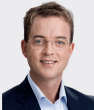
Esben Lunde Larsen, Venstre:

“Jeg håber, at det vil udvikle sig i en retning, hvor de to bliver ligeværdige samarbejdspartnere. Jeg kunne fx godt tænke mig, at universiteterne blev forpligtede til at samarbejde med professionshøjskolerne, præcis som professionshøjskolerne i dag er forpligtede til at samarbejde med universiteterne”.