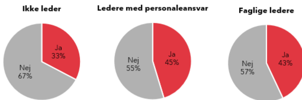
Figur 2. Andel, der har modtaget efteruddannelse inden for det seneste år

Ser man på hvilken type af efteruddannelse, som de privatansatte DM'ere har modtaget, så er det overvejende privat udbudt efteruddannelse eller interne kurser, som de har benyttet sig af.