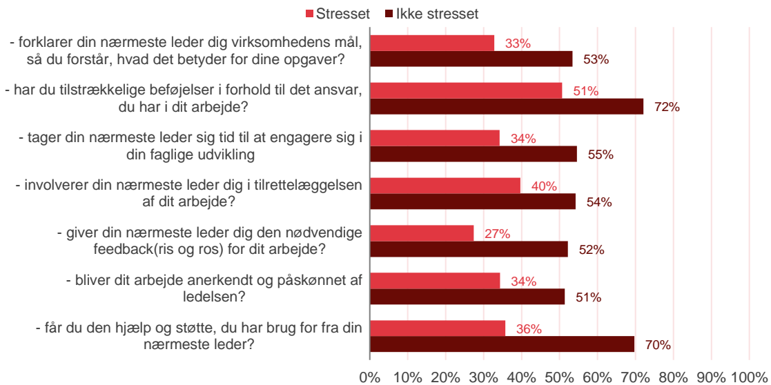
Figur 1. Ledelseskvalitet. Andele der svarer Altid eller Ofte på følgende spørgsmål. Hvor ofte...

Note: Respondenterne skulle svare, hvor ofte det gjaldt for dem. De kunne svare Altid , Ofte , Sommetider , Sjældent og Aldrig . Figuren viser andelen, der har svaret Altid eller Ofte .